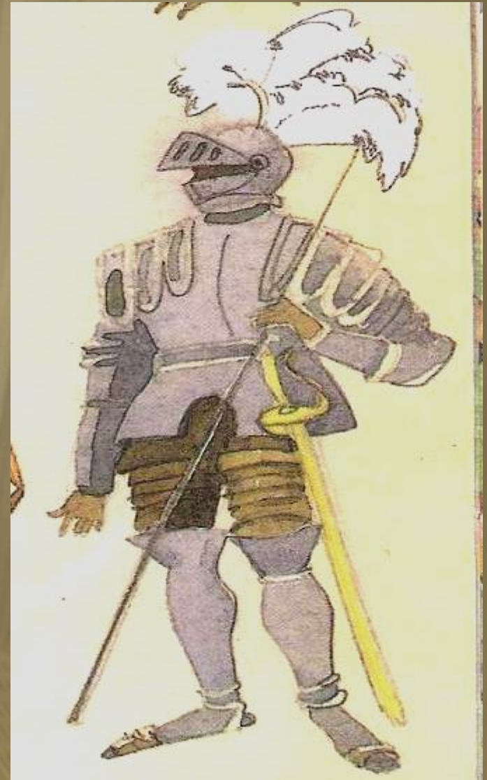
Это были личные знаки рыцарей