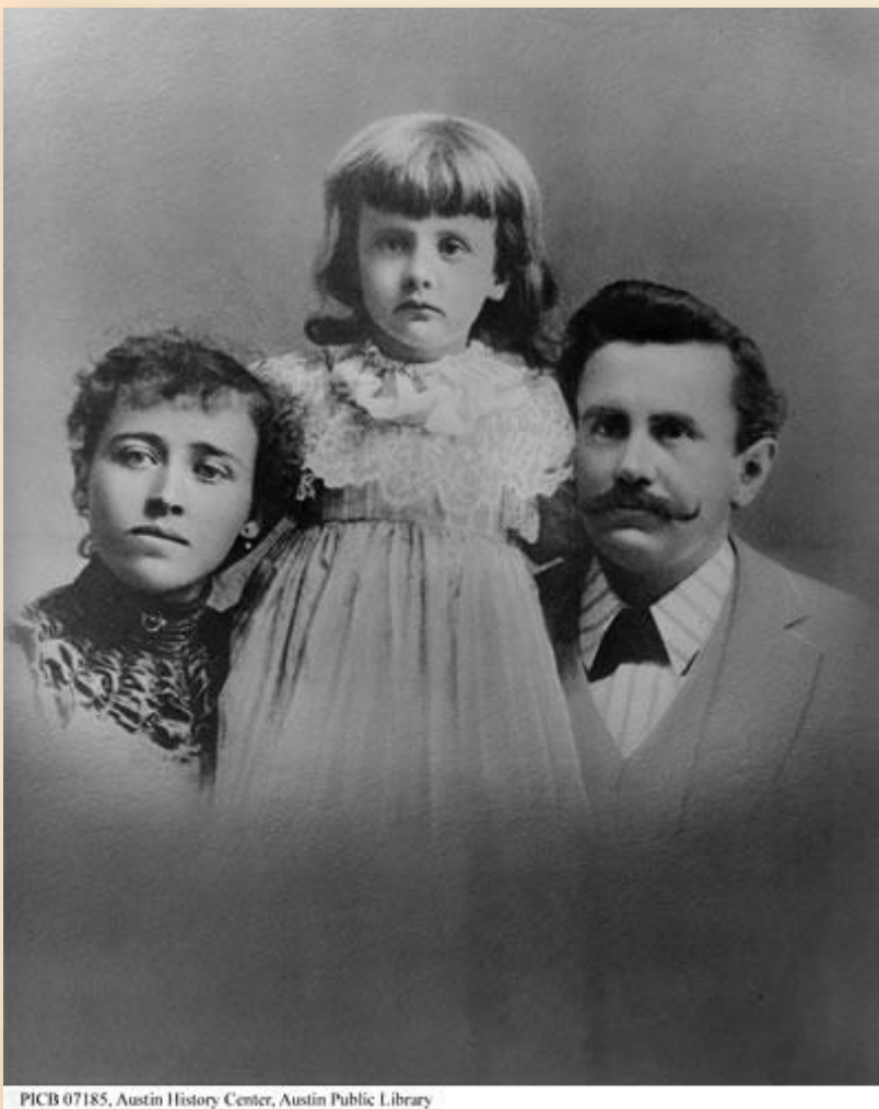
PICB 07185, Austin History Center, Austin Public Library