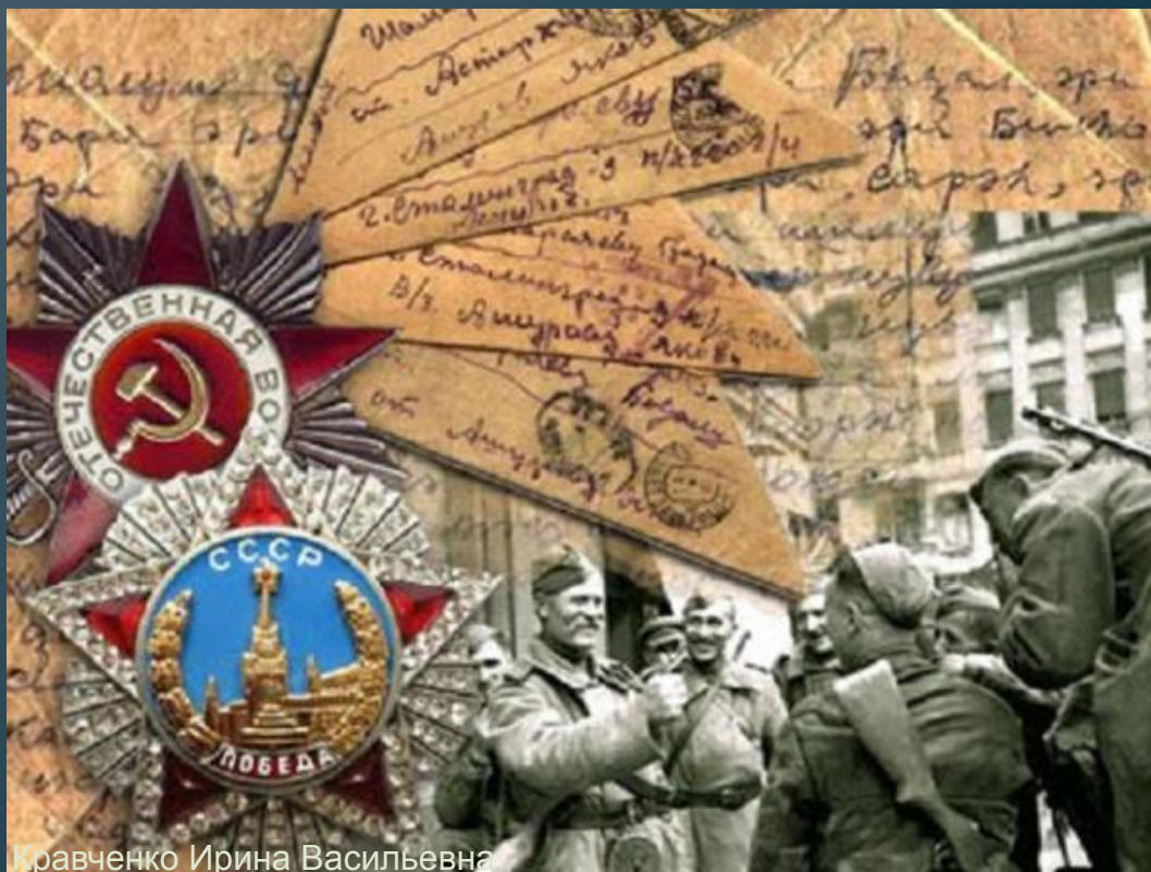
Кравченко Ирина Васильевна

Враг продвигался с тяжелыми боями от пограничной Брестской крепости до Смоленска, от Киева до Тулы и всюду встречал героическое сопротивление. Яростный отпор получил противник под городом Ельней. Здесь на какое-то время неудержимый натиск немецких полчищ был приостановлен.