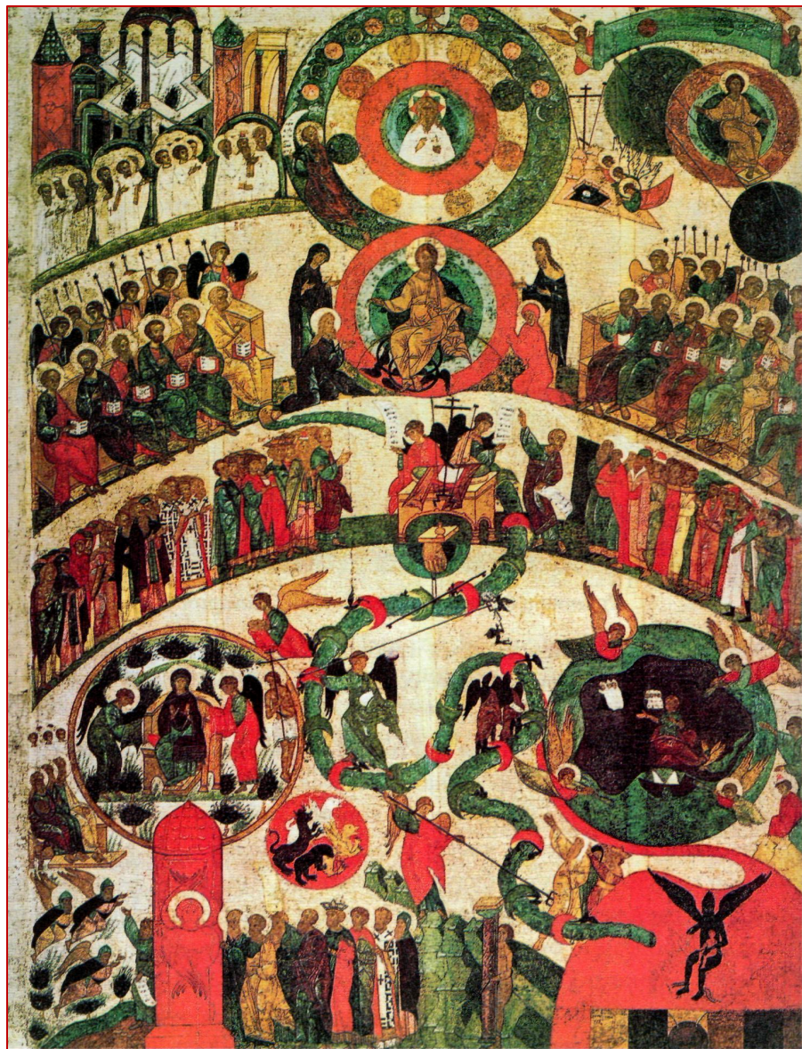
Страшный суд. Икона

В зависимости от дел Он разделит всех людей на добрых и злых, Праведники пойдут в жизнь вечную, а грешники — в муку вечную.