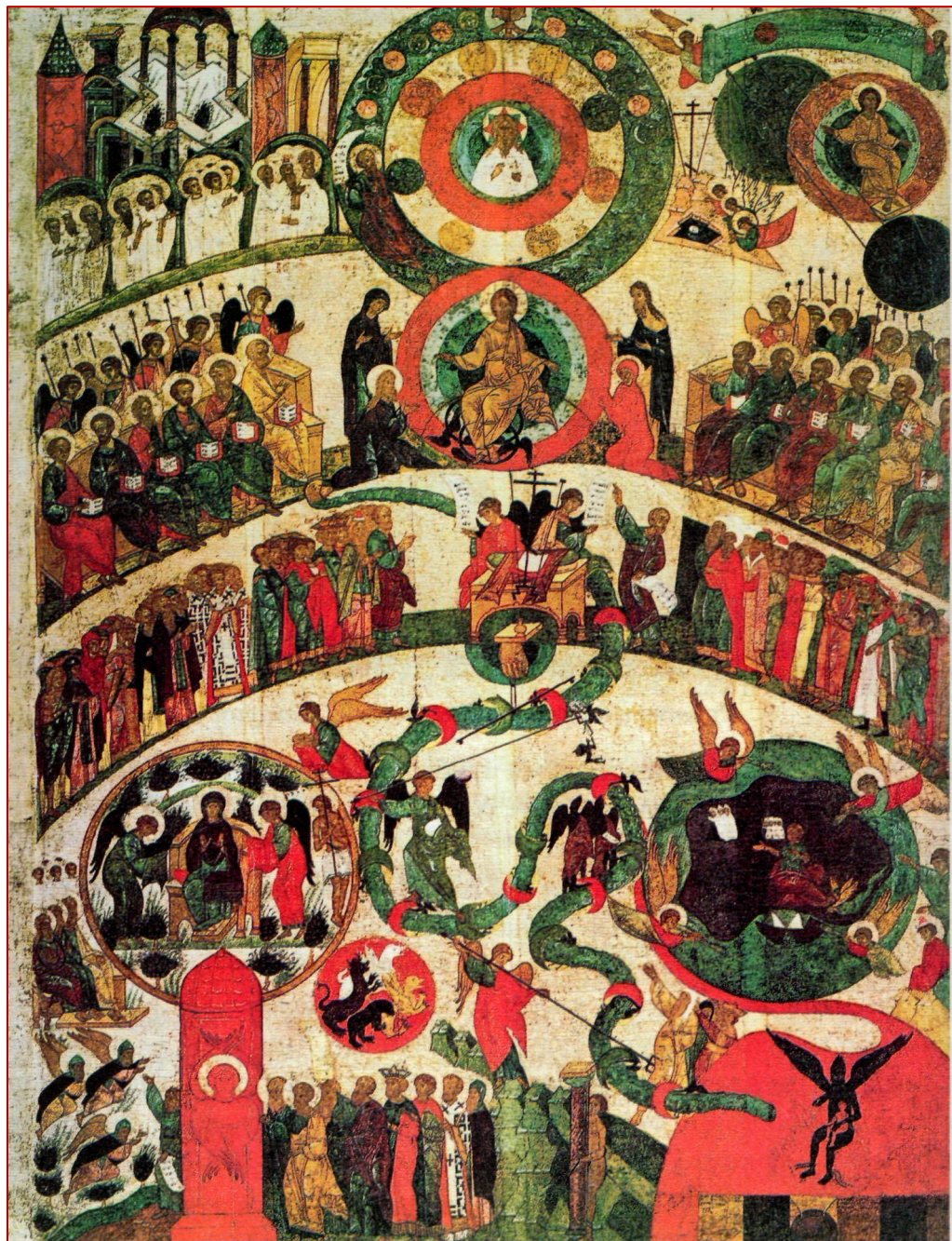
Страшный суд. Икона