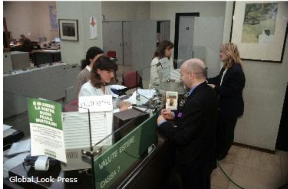
Global Look Press