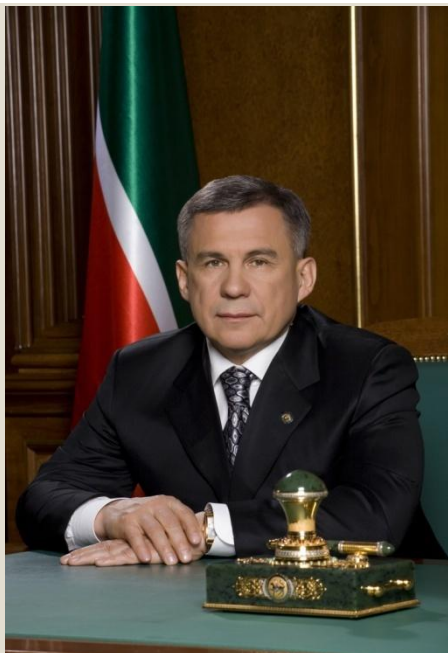
МИННИХАНОВ РУСТАМ НУРГАЛИЕВИЧ Председатель Совета директоров ОАО «Татнефть» — Президент Республики Татарстан