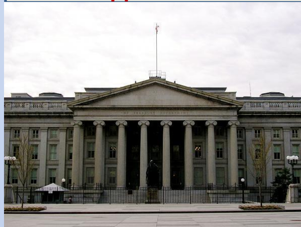
Міністерства та відомства