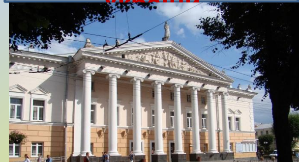
Державне казначейство України