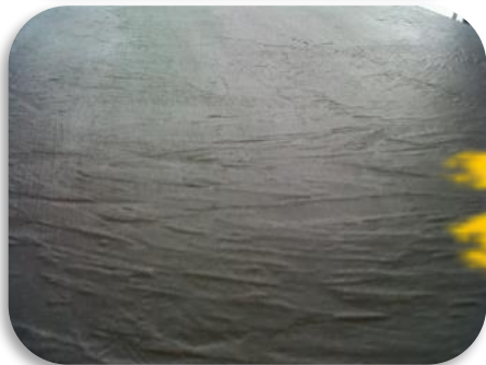
Фреска – под натуральный камень