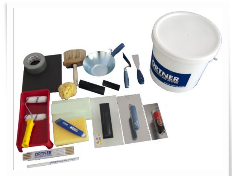
Полный готовый набор для создания фрески