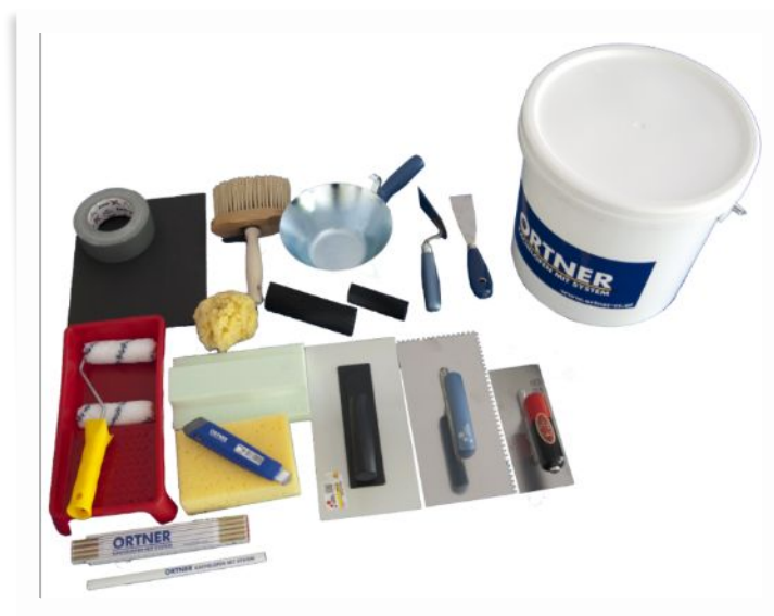
Полный готовый набор для создания фрески