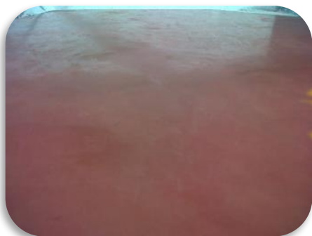
Фреска - гладкая