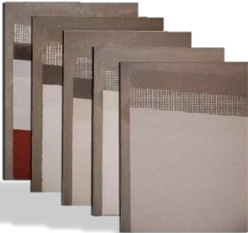
Плиты – образцы облицовки