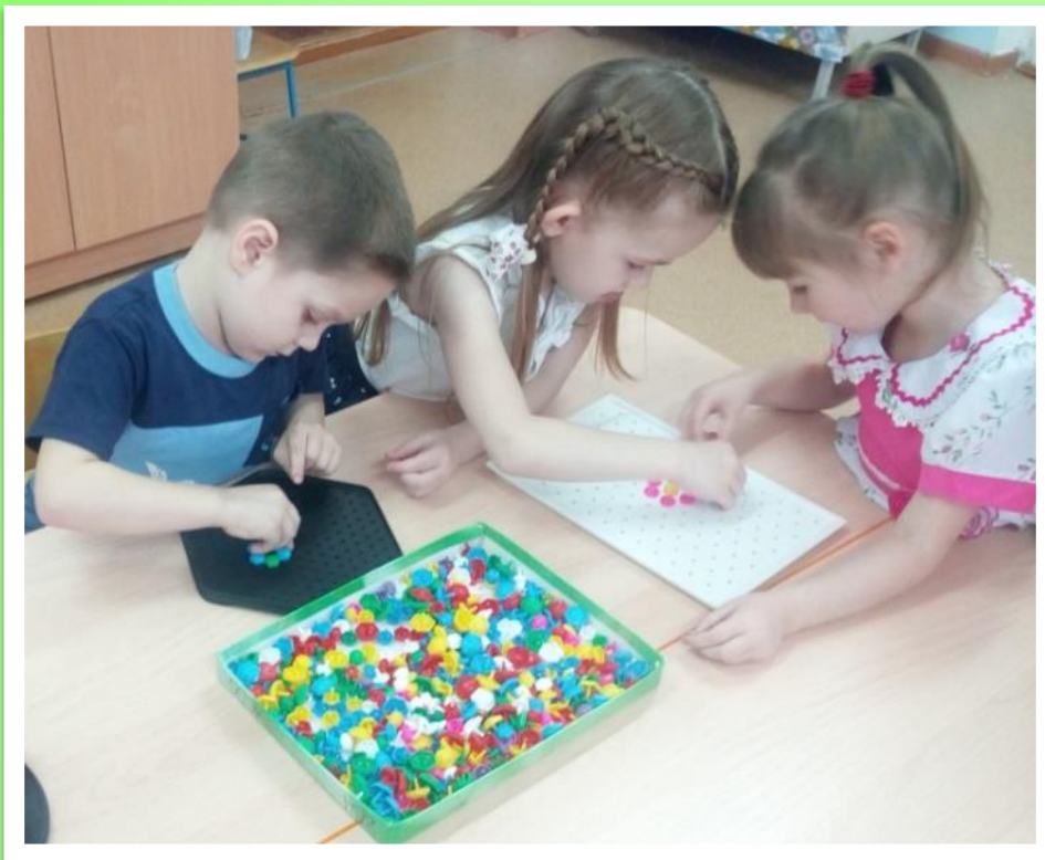
Выкладывание из мозаики различных предметов