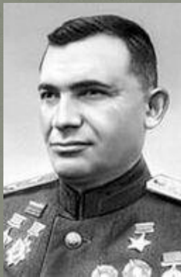
Яков Григорьевич Крейзер