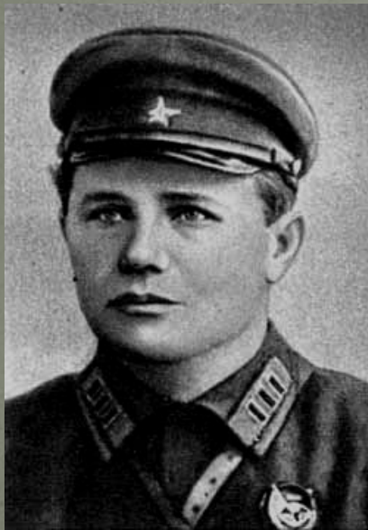
Андрей Иванович Ерёменко

51-я армия генерал-лейтенанта Я. Г. Крейзера и 2-я гвардейская армия генерал-лейтенанта Г. Ф. Захарова наступавшие с севера, стремительно продвигались к Севастополю. 15 апреля советские войска вышли на подступы к городу, а 17 - к укрепленным позициям Севастополя подошли соединения Отдельной Приморской армии.