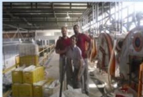
出口到伊朗设备生产现场