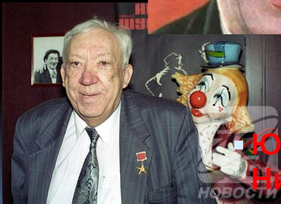
■ Юрий Никулин