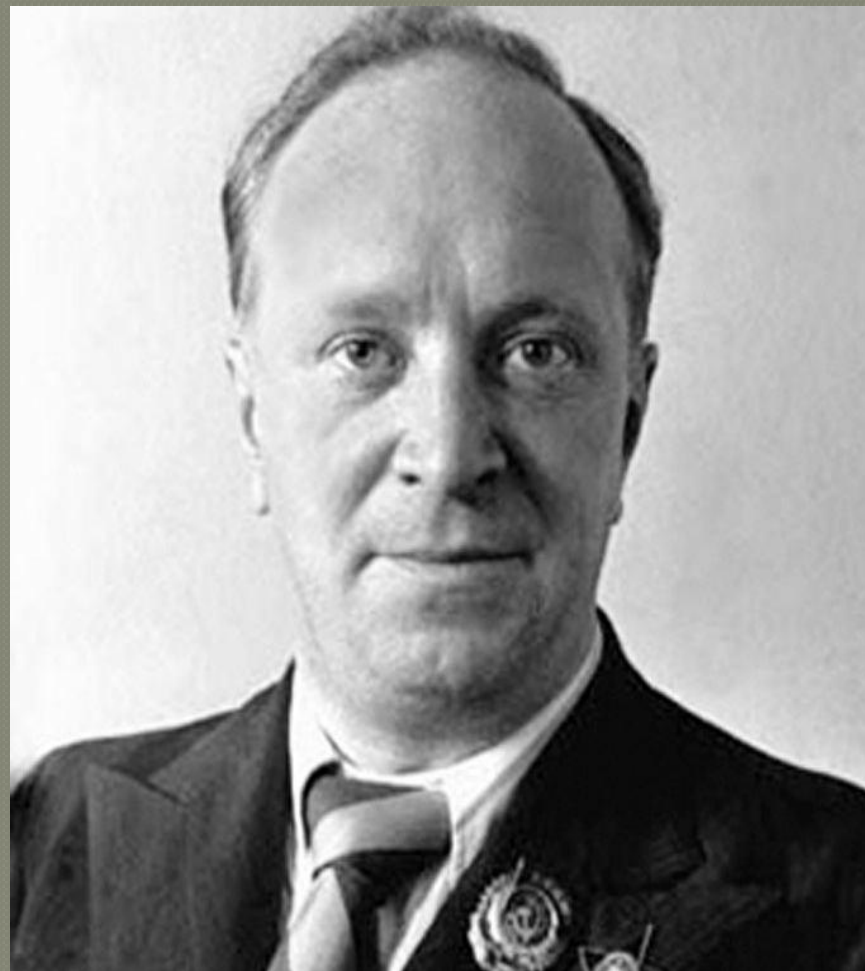
поэт В.И. Лебедев-Кумача