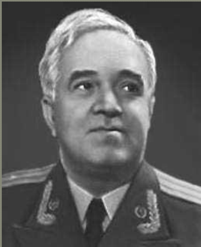
Композитор А.В. Александров