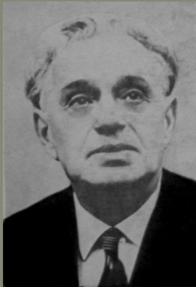
композитор Константин Листов