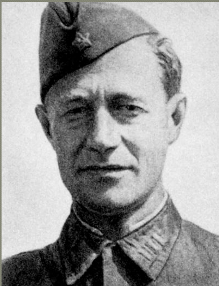
поэт Алексей Сурков