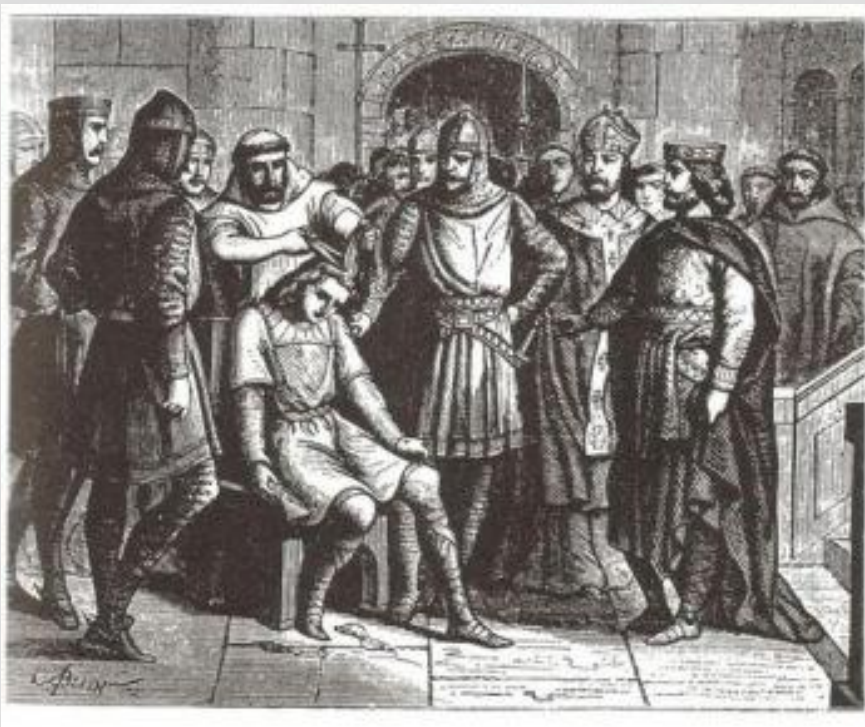
Низложение последнего Меровинга