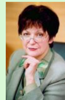
Роговцева Н. И.