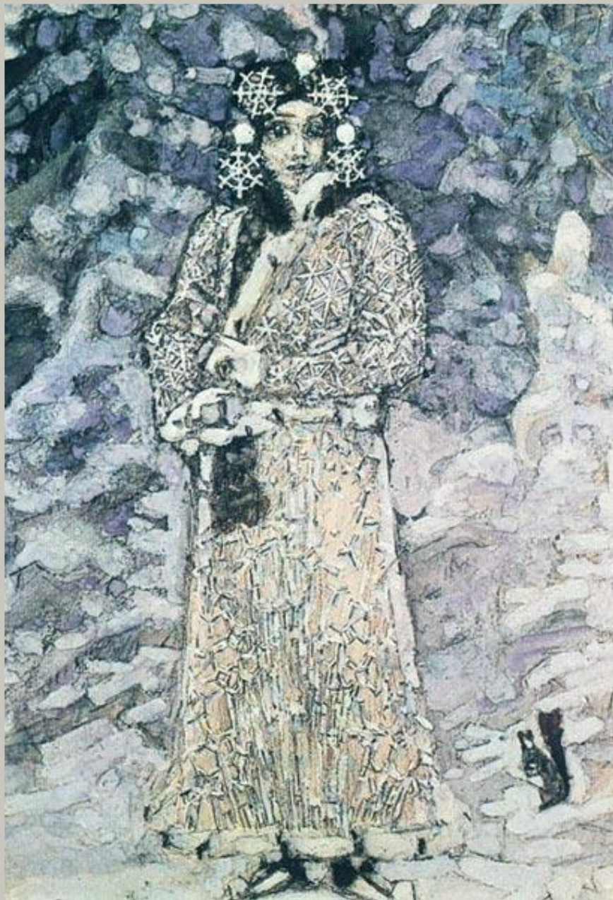
Художник Михаил Врубель "Снегурочка" 1890