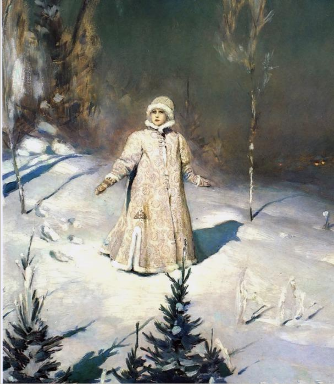
Художник В. М. Васнецов «Снегурочка»