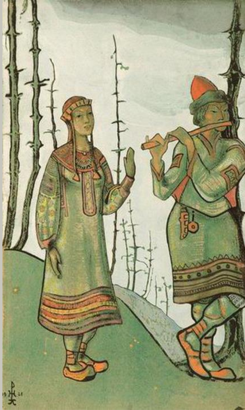
Художник Николай Рерих Снегурочка и Лель,