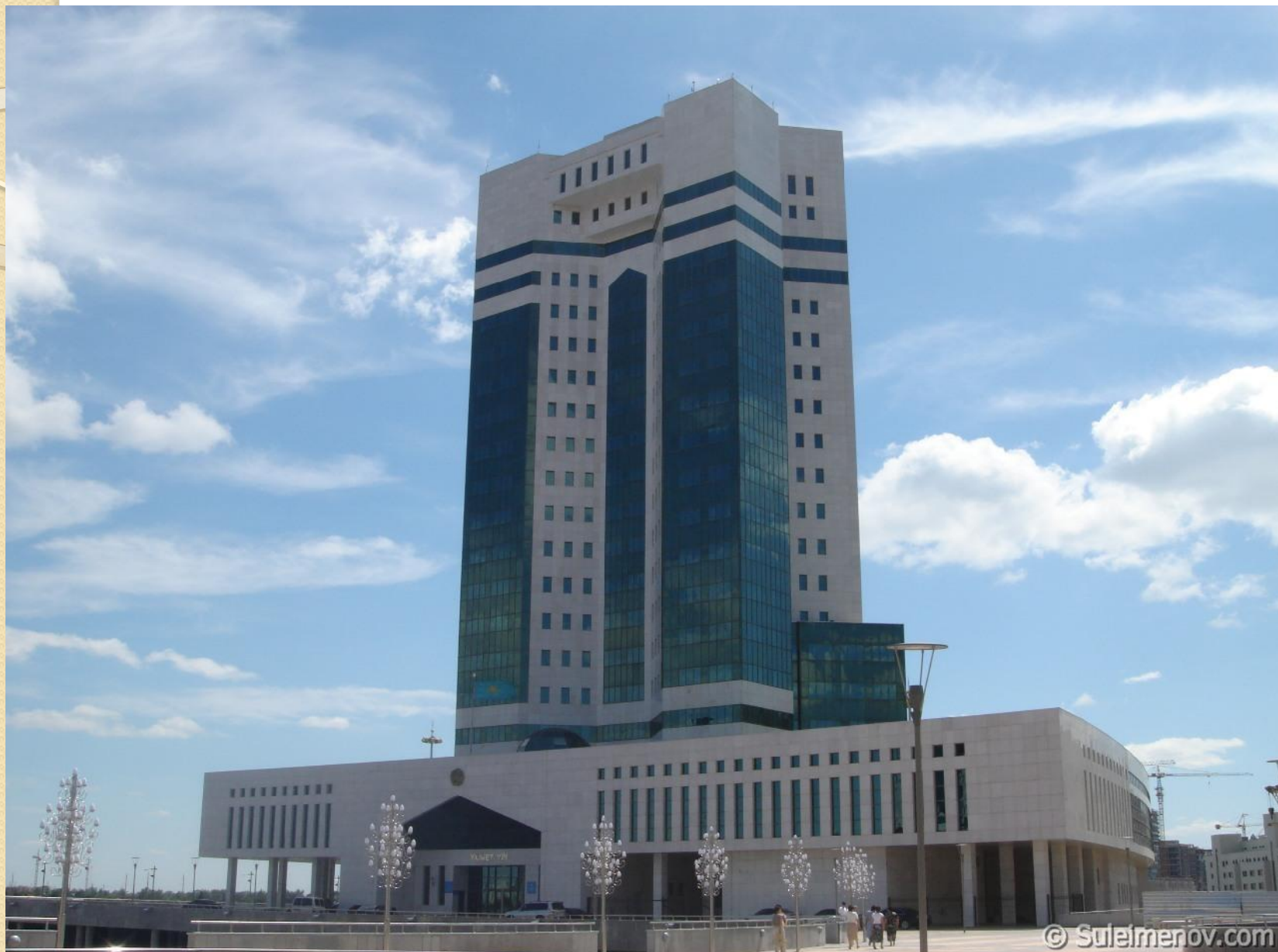
Дом Правительства Республики Казахстан