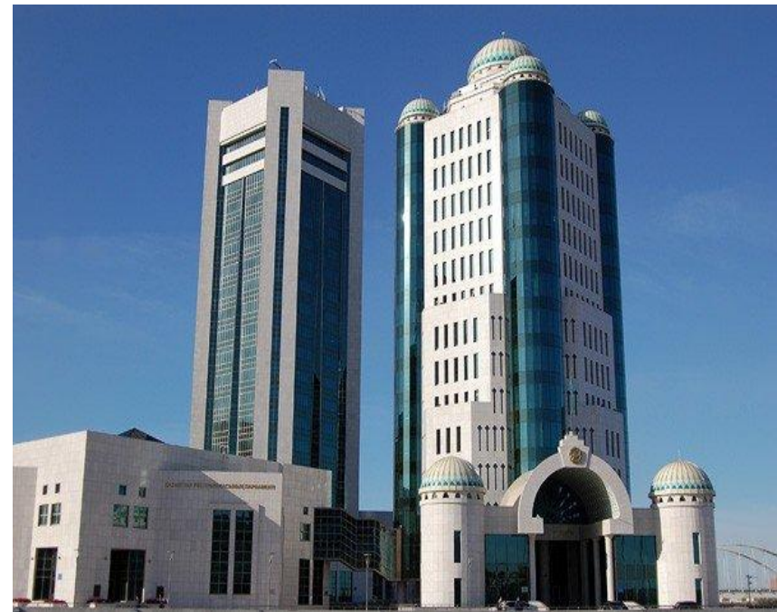
Здание Парламента Республики Казахстан

Депутат Парламента не может быть одновременно членом обеих Палат.