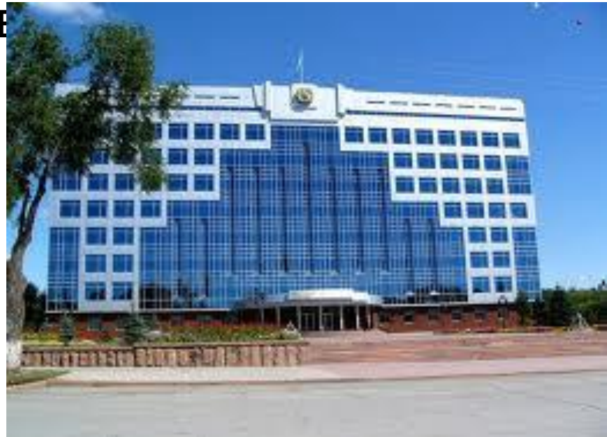
Акимат города Костанай