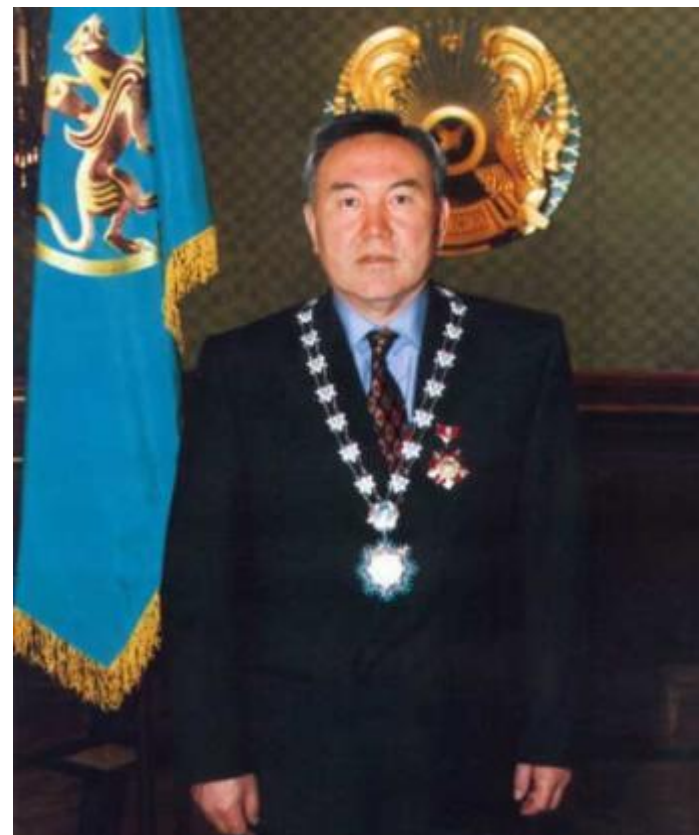
Президент Республики Казахстан

Президент Республики Казахстан избирается совершеннолетними гражданами Казахстана на основе всеобщего, равного и прямого избирательного права при тайном голосовании. Резиденции Президента Республики Казахстан - «Ак орда». Расположена на территории нового административного центра Астаны на левом берегу реки Ишим. Официальная презентация Дворца Президента РК