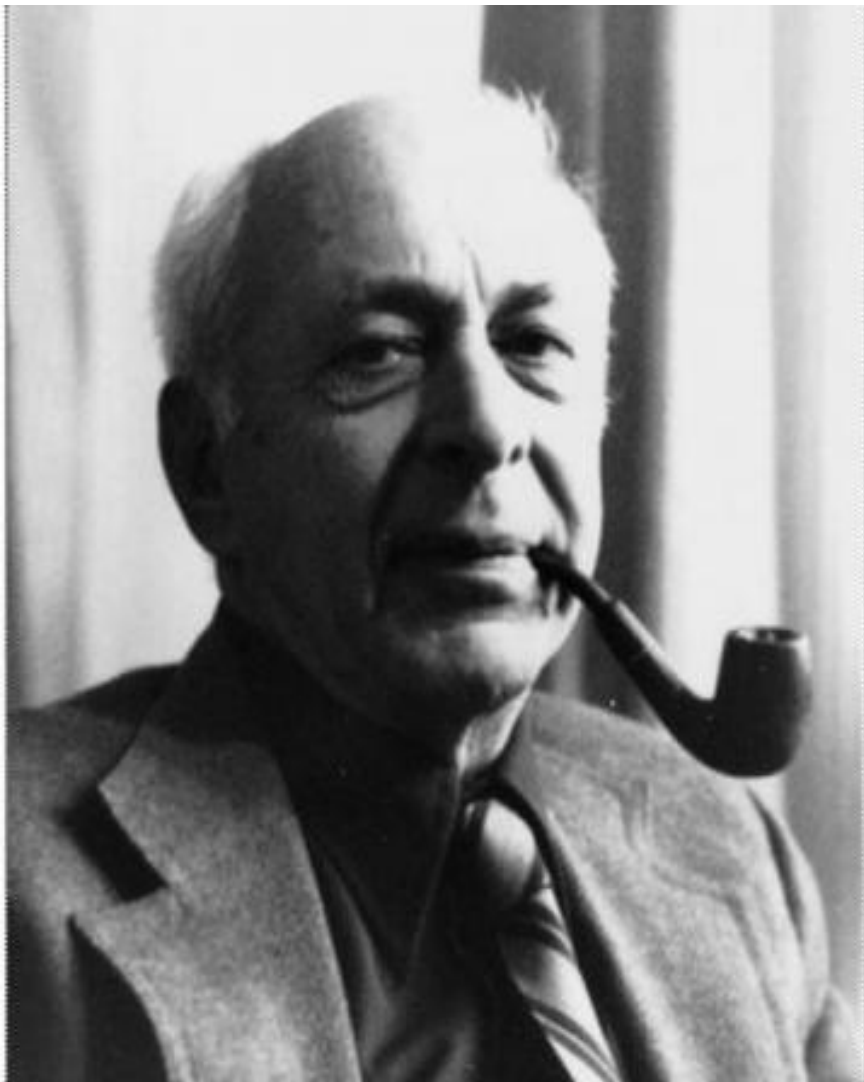
Джулиан Роттер (1916 -2014)

Кем люди бывают чаще - хозяевами собственной судьбы или жертвами обстоятельств?