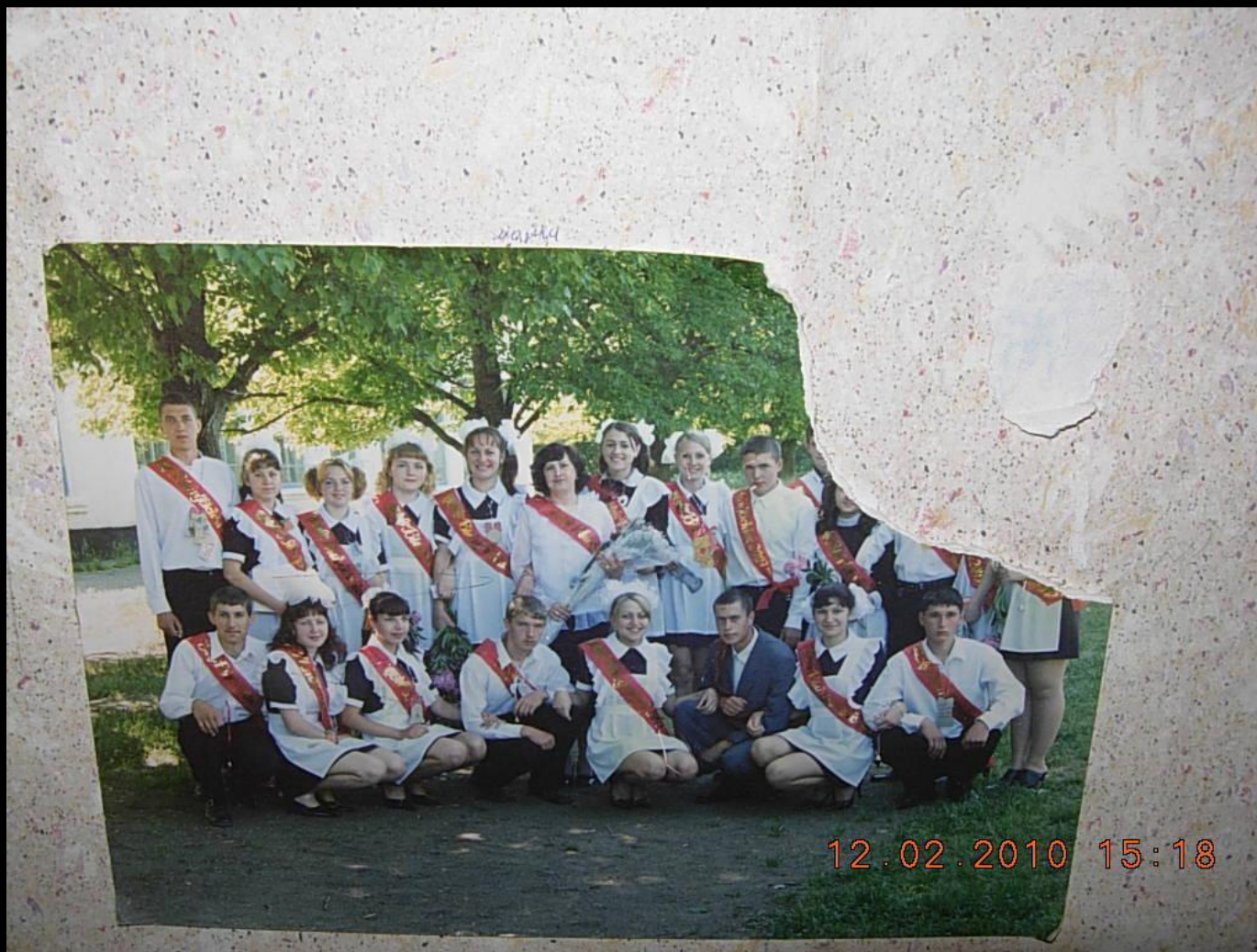
Вандалы МОУ СОШ № 8 х.Шунтук