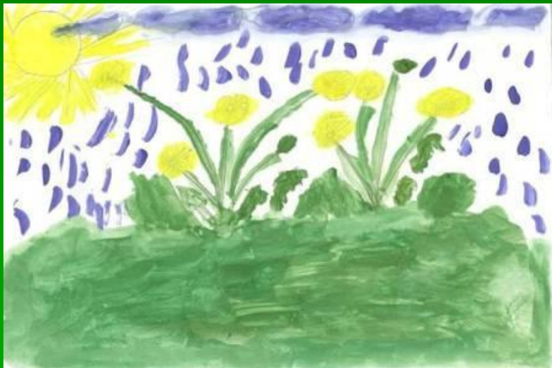
работа Хамзина Рустама