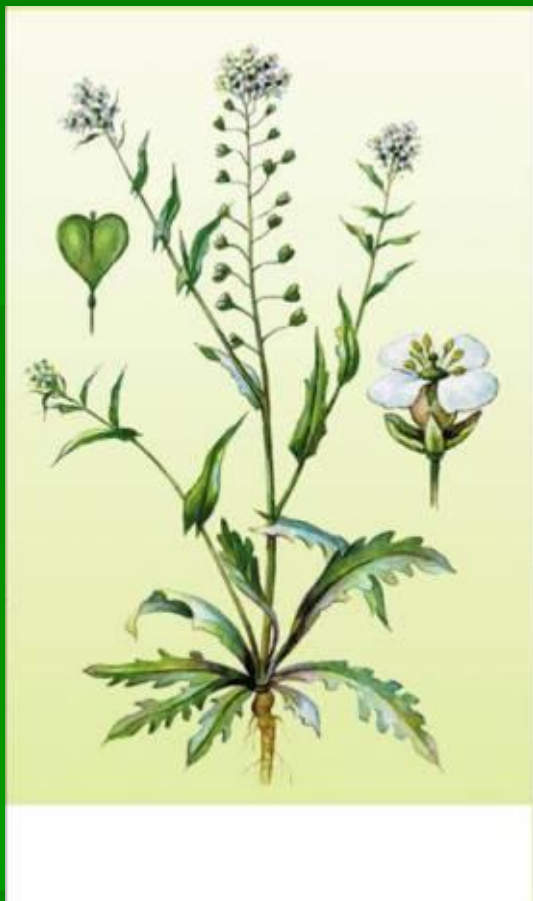
Пастушь я сумка