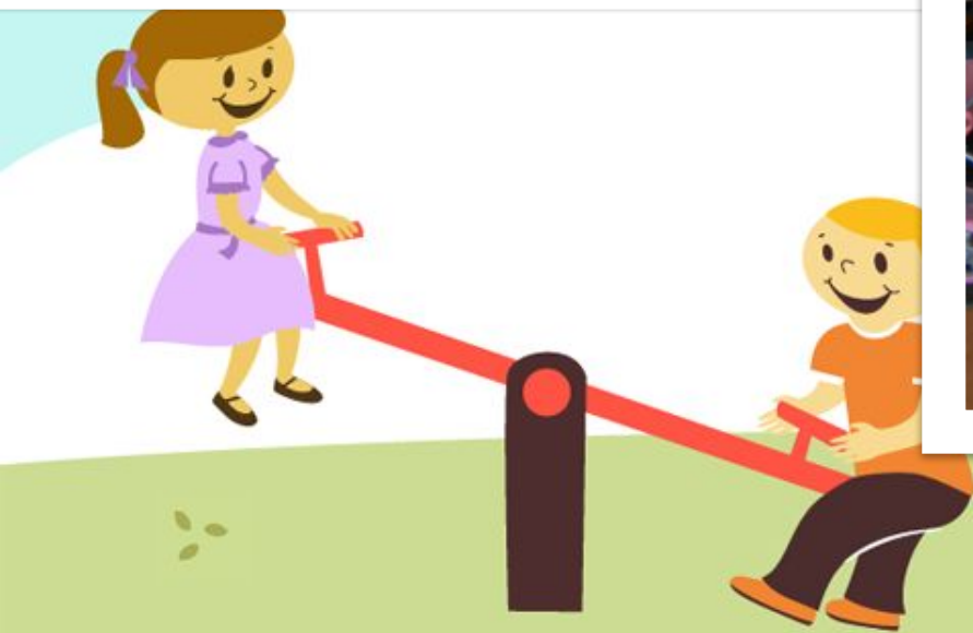
Наша 1 група