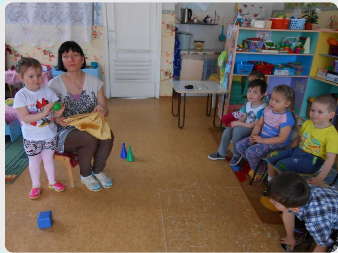
Дидактическая игра «Чудесный мешочек»