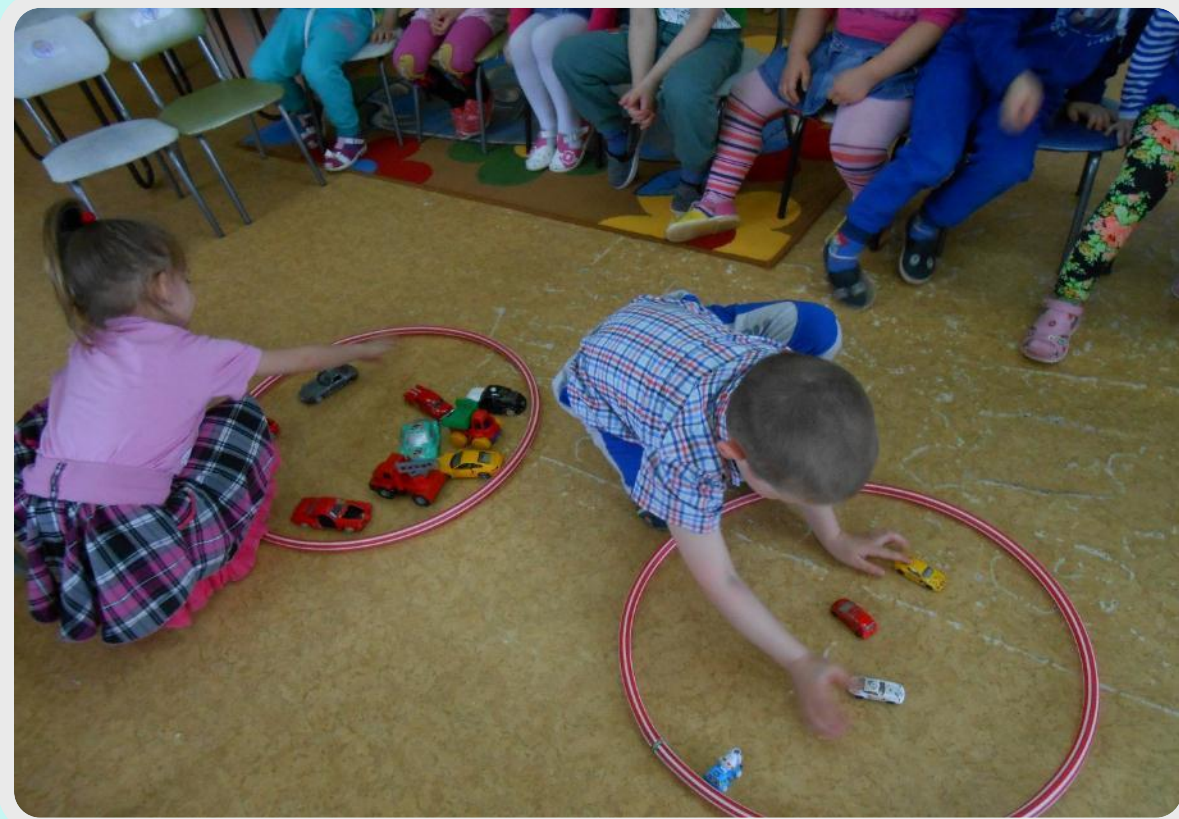
Дидактическая игра «Раздели на группы»