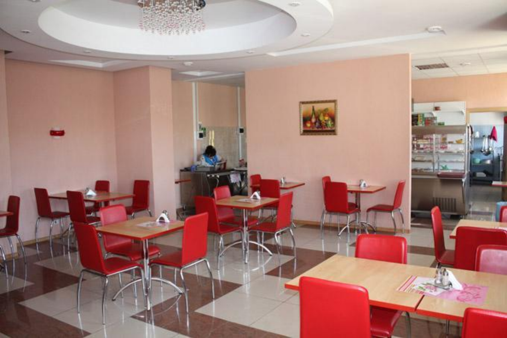
Кафе на 2 этаже «Gold line»