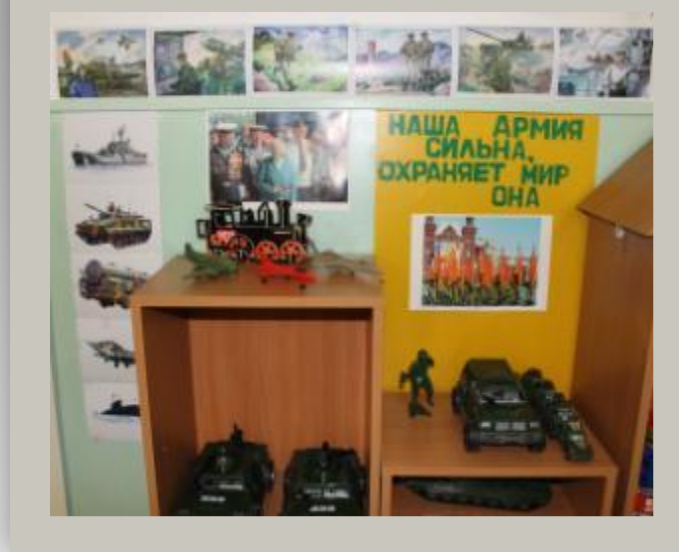
Патриотический центр «Моя Родина»