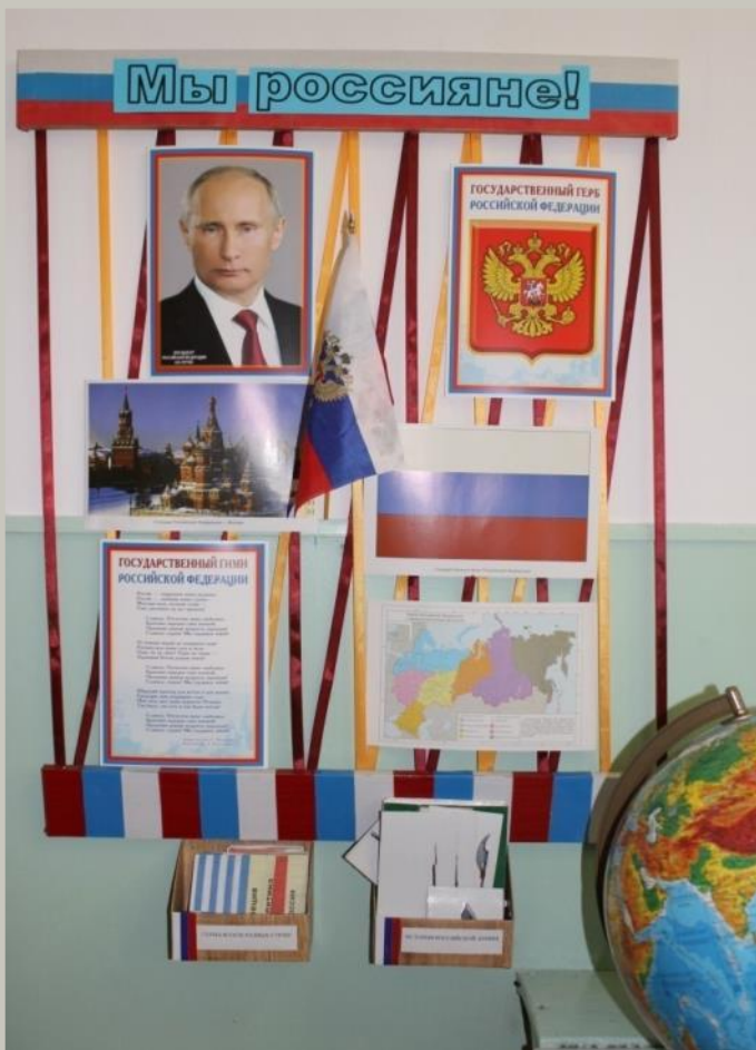
Мини-музей «Неизведанная Вселенная»