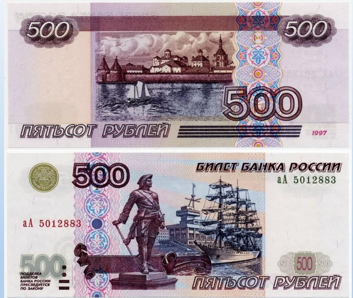
Банкнота достоинством 500 рублей

На оборотной стороне банкноты: вверху слева и справа - числа 500 в узорных розетках, в центре - гравюра с изображением Соловецкого монастыря. Внизу - крупное число 500, текст «ПЯТЬСОТ РУБЛЕЙ» Справа в центральной части расположена вертикальная орнаментальная полоса.