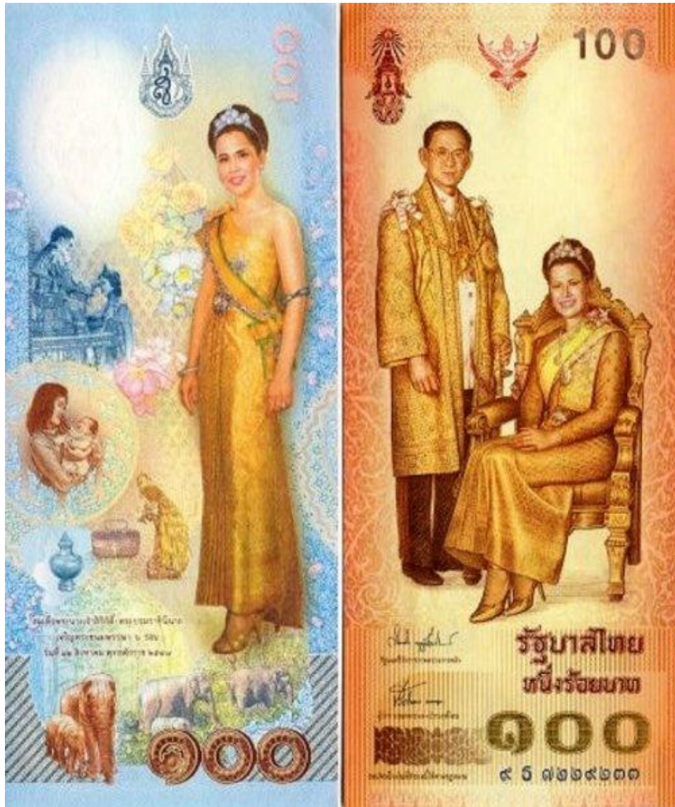
Памятная банкнота в 100 тайских батов

В 2004 году Тайская Королева отпраздновала свой семьдесят второй день рождения и к этому дню национальный банк выпустил памятную банкноту, на которой изображалась она рядом с мужем, королём Рамой IX. Обратная сторона охватывает важные сцены из жизни королевы.