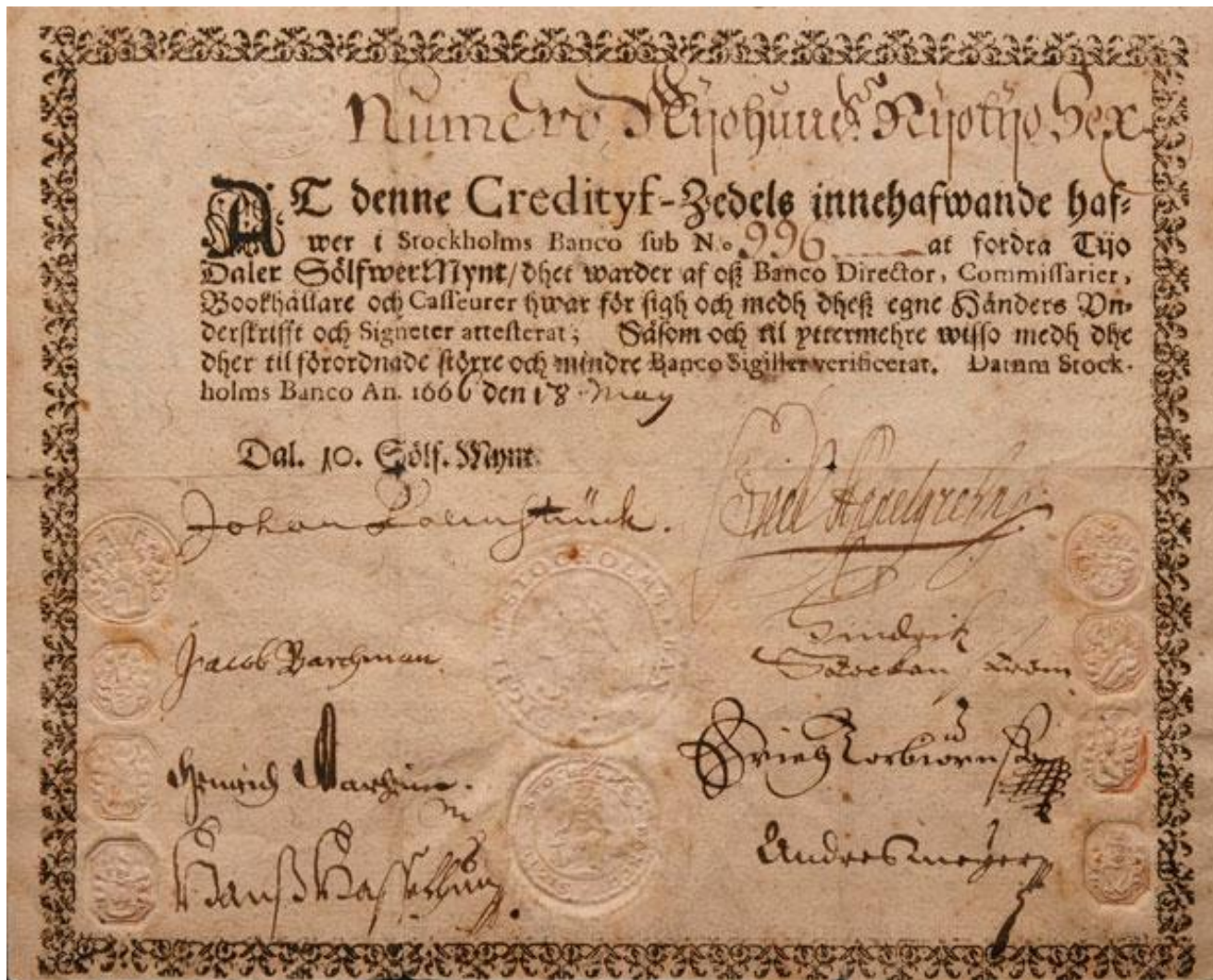
Банкнота Стокгольмского Банка