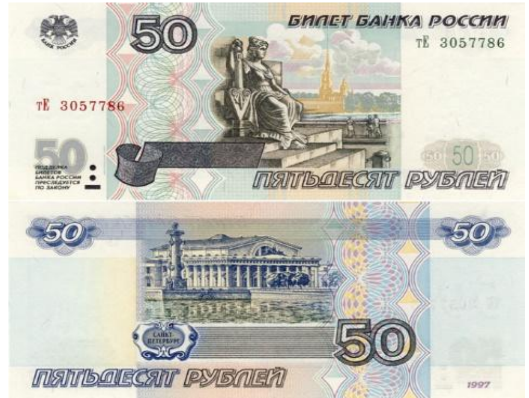
Банкнота номиналом в 50 рублей

На оборотной стороне банкноты: вверху слева и справа расположены числа 50 в узорных розетках и горизонтальные линии микротекста «50», отпечатанные синей краской. В центре - гравюра с изображением здания бывшей биржи и Ростральной колонны в г. Санкт-Петербурге.