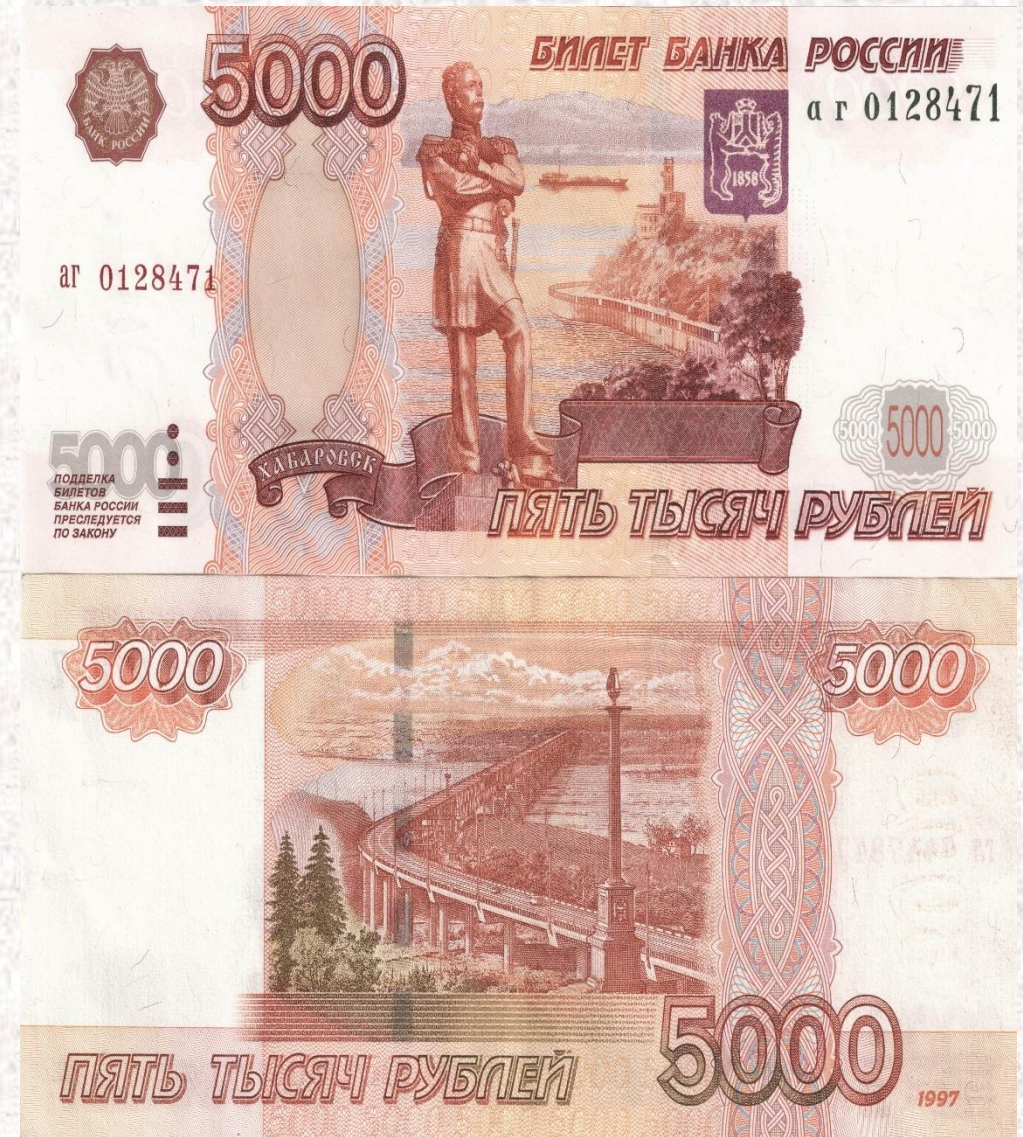
Банкнота достоинством 5000 рублей

Банкнота изготовлена на белой высококачественной хлопковой бумаге. В бумагу внедрены волокна светло-зеленого, красного и серого цвета, а также волокна с чередующимися участками красного и синего цветов. В бумагу внедрена широкая металлизированная ныряющая защитная нить с голографическим покрытием. Бумага имеет локальные водяные знаки, размещенные слева и справа на купонных полях. Основные изображения лицевой стороны - памятник Н.Н. Муравьеву-Амурскому, набережная в г. Хабаровске. Основное изображение оборотной стороны - мост через р. Амур в г. Хабаровске. Преобладающий цвет банкноты - красно-коричневый. Преобладающий цвет банкноты - красно-коричневый. Банкнота обладает несколькими машиночитаемыми защитными признаками. машиночитаемыми защитными признаками.