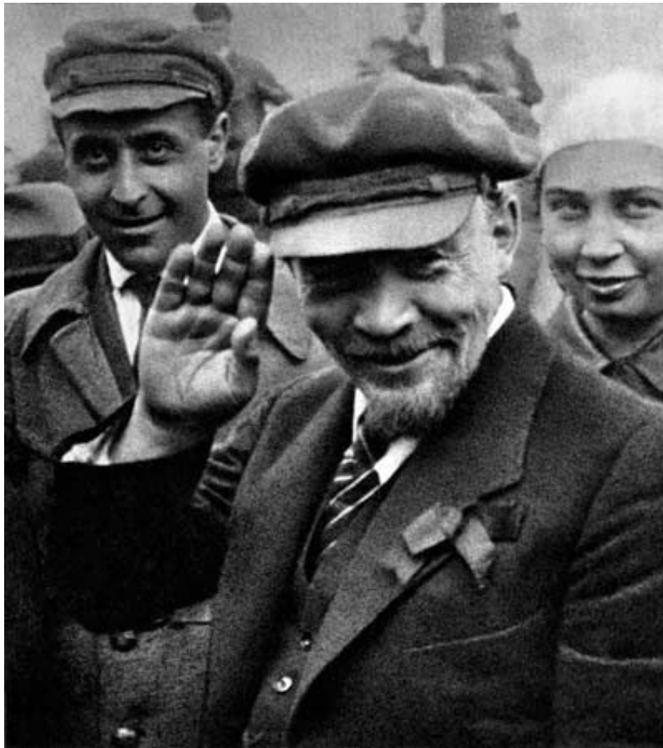
Владимир Ильич Ульянов-Ленин