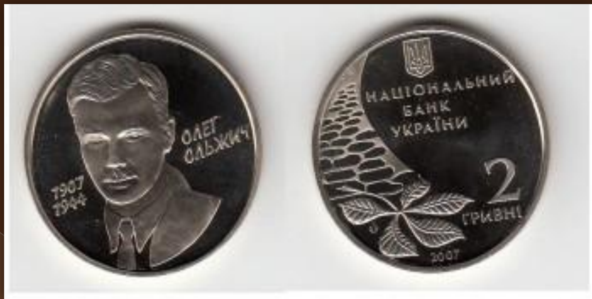
Монета (Олег Ольжич) номіналом 2 гривні