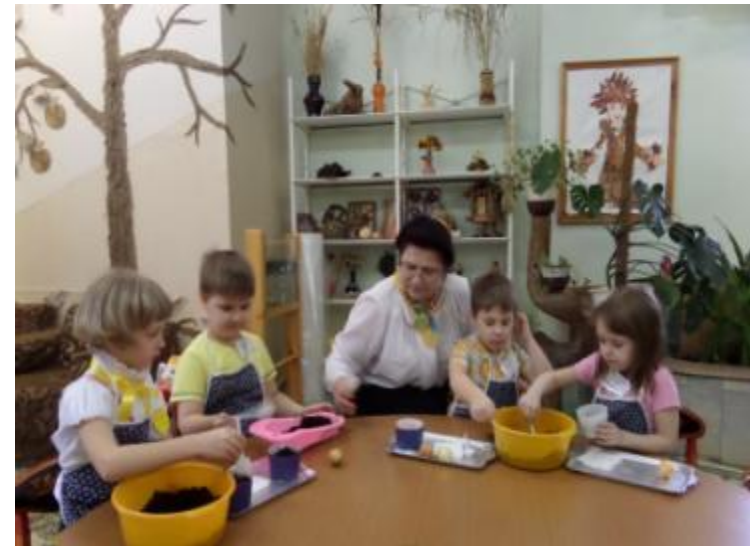
практическая деятельность по посадке лука