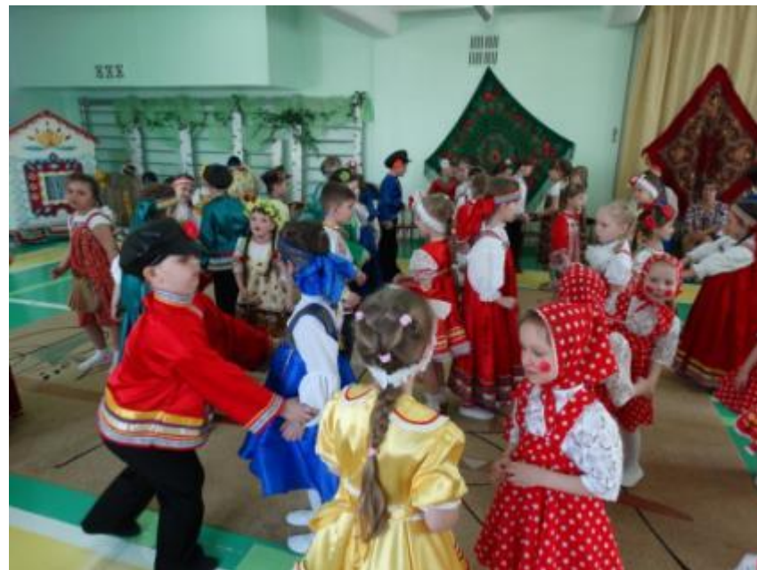
фестиваль фольклорной песни «Посиделки»