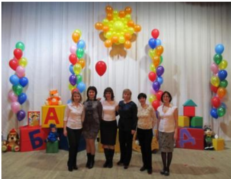
Городской детский концерт «АБВГдейка»

Детский поэтический конкурс «Зеленогорским поэтам слава!»