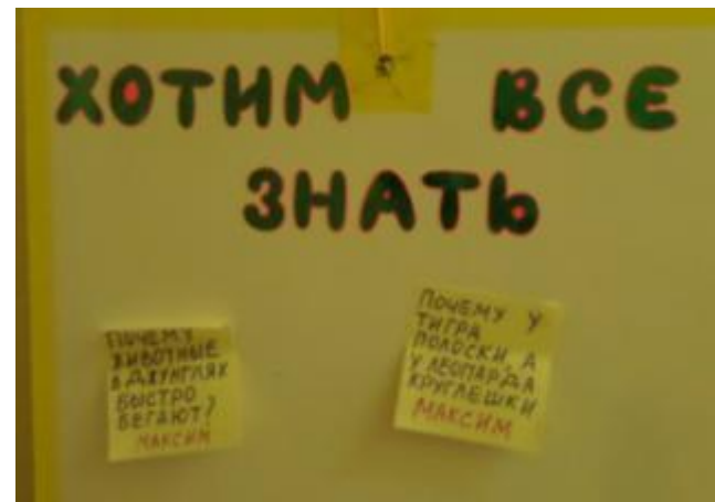
стенд детских вопросов