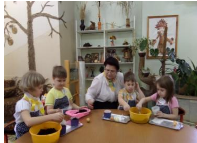
практическая деятельность по посадке лука