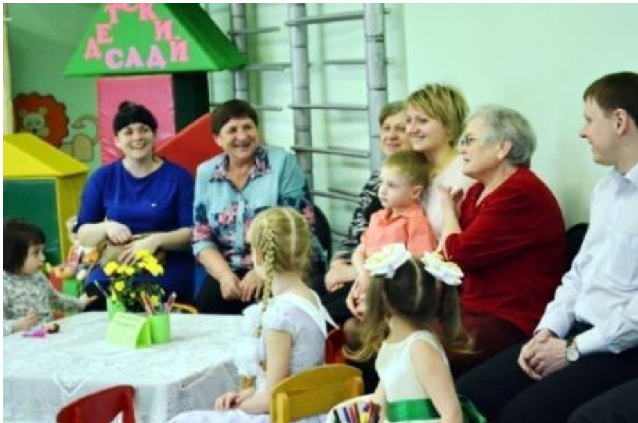
встреча семейных династий «Семейный детский сад»