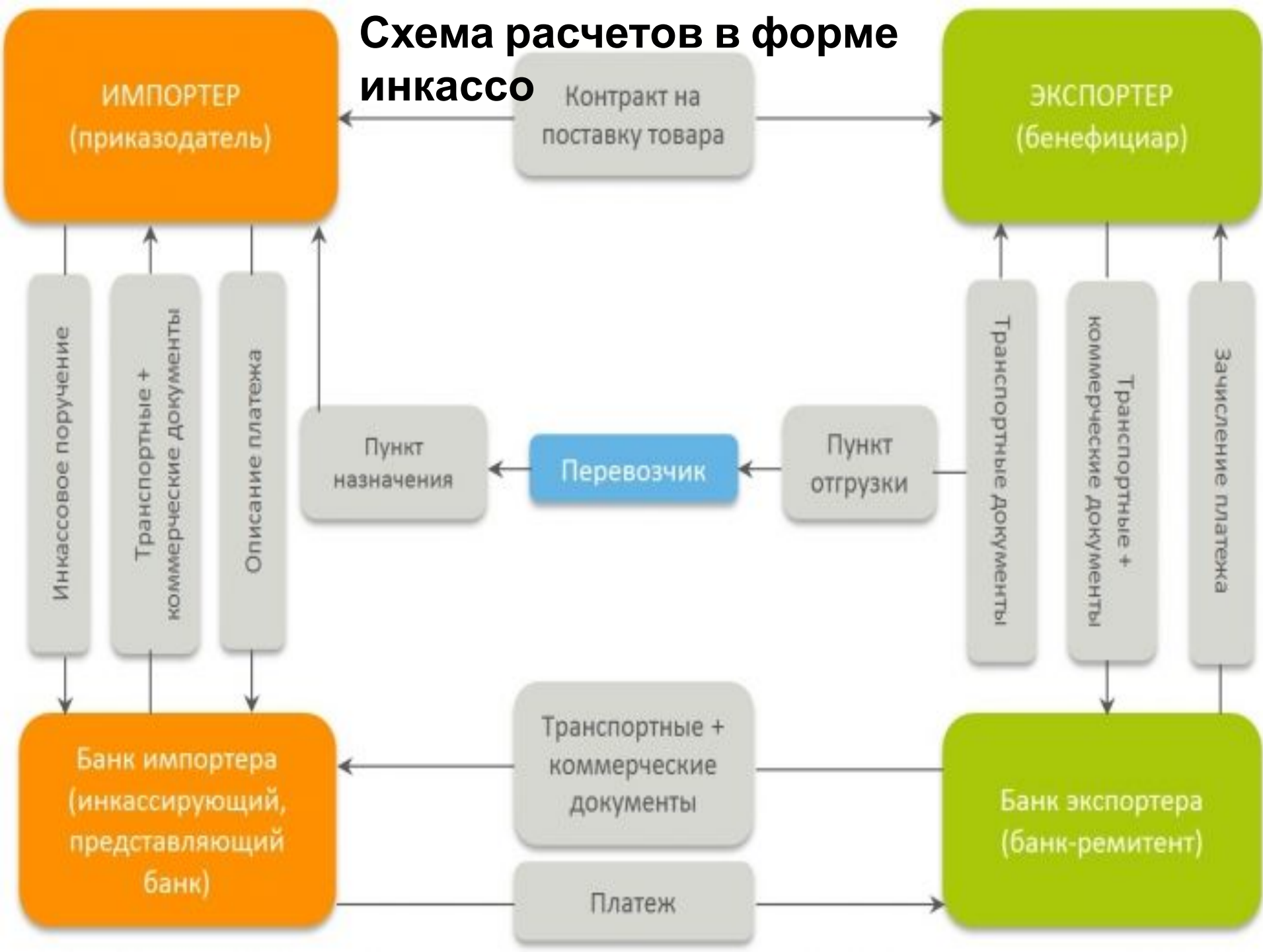
Схема расчетов в форме инкассо