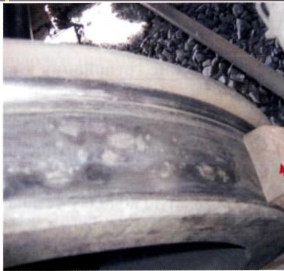
Чугунная тормозная колодка