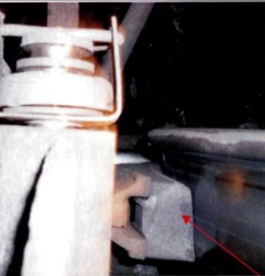
Традиционная тормозная колодка.