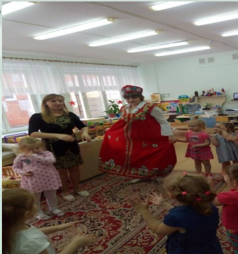
Развлечение «В гости к нам матрешка пришла»

Необходимо поощрять приход родителей в группу для наблюдения за детьми и игры с ними . У родителей и детей могут быть общие интересы или умения. Взрослые могут помогать воспитателям , принимать участие в спектаклях , помогать в организации мероприятий, обеспечивать транспортом , обустроить и укра