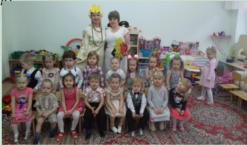
Развлечение «Осень Золотая»