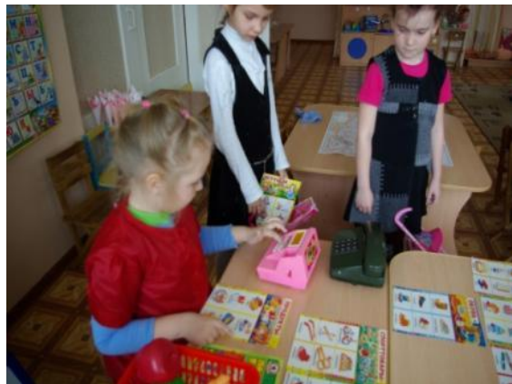
СЮЖЕТНО – РОЛЕВЫЕ