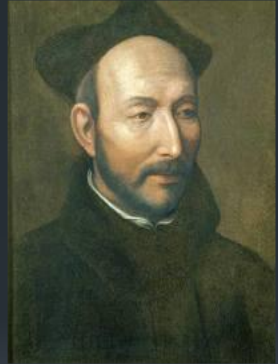
Игнатий де Лойола

В конце 1536 года он с группой товарищей (среди них Пьер Фавр из Савойи, Франциск Ксаверий из Наварры, португалец Симан Родригиш) отправился в Рим и в ноябре 1537 года поступил на службу церкви.