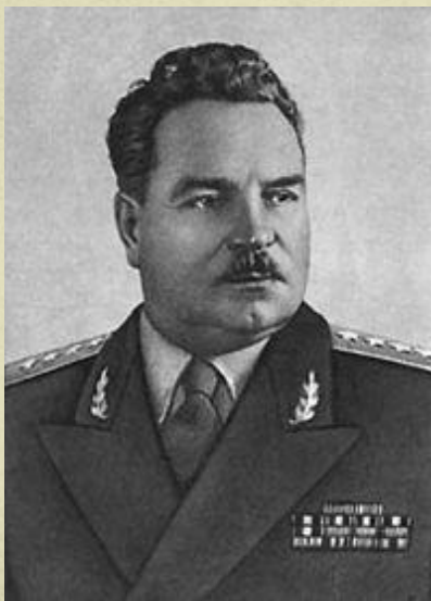
Тюленев, Иван Владимирович