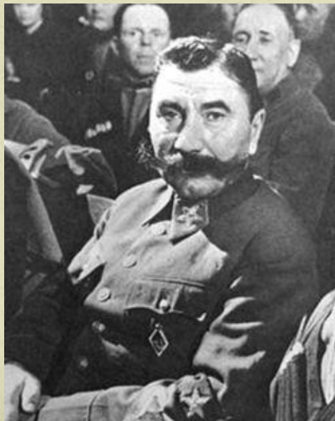
Будённый, Семён Михайлович