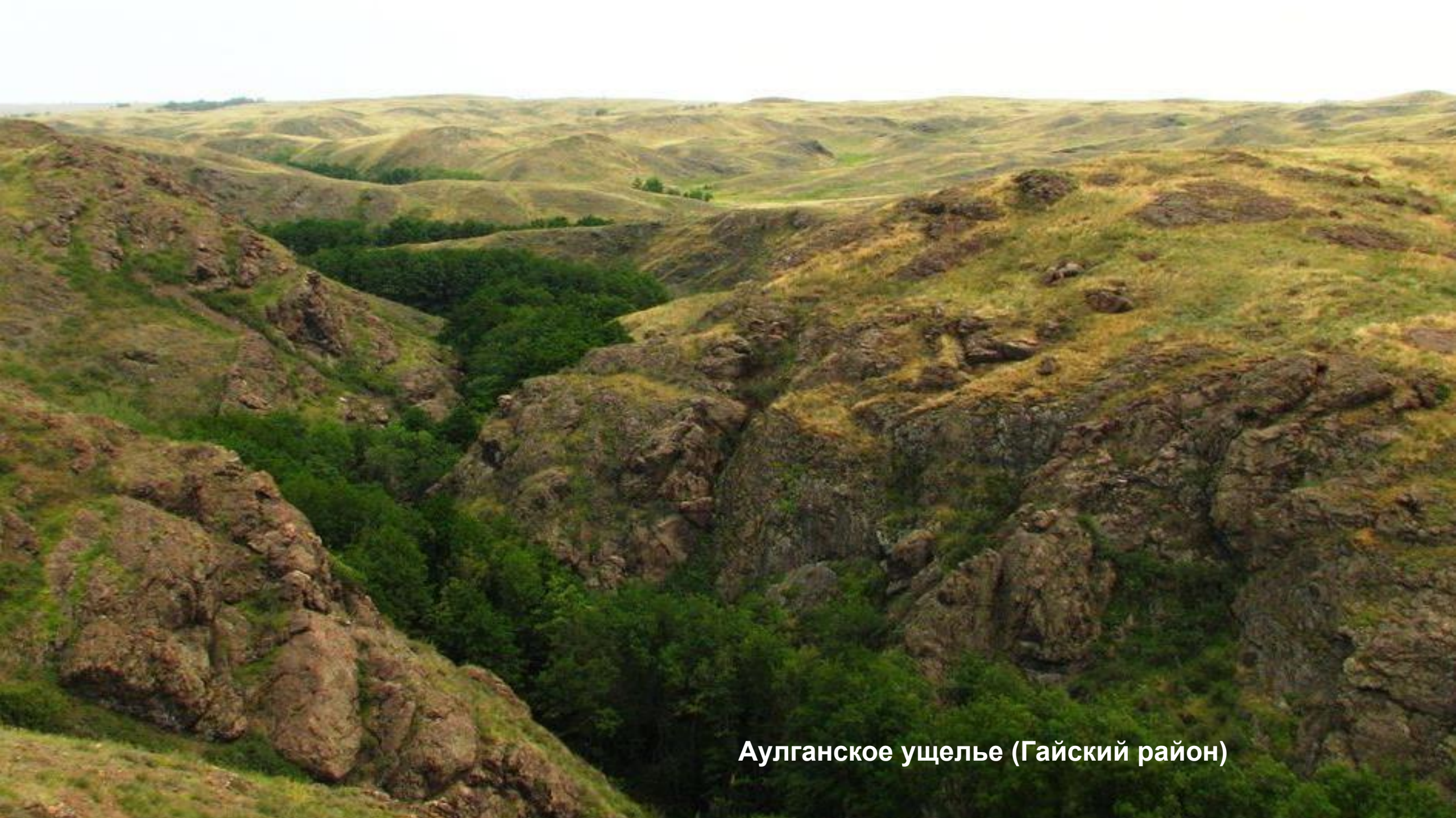
Аулганское ущелье (Гайский район)