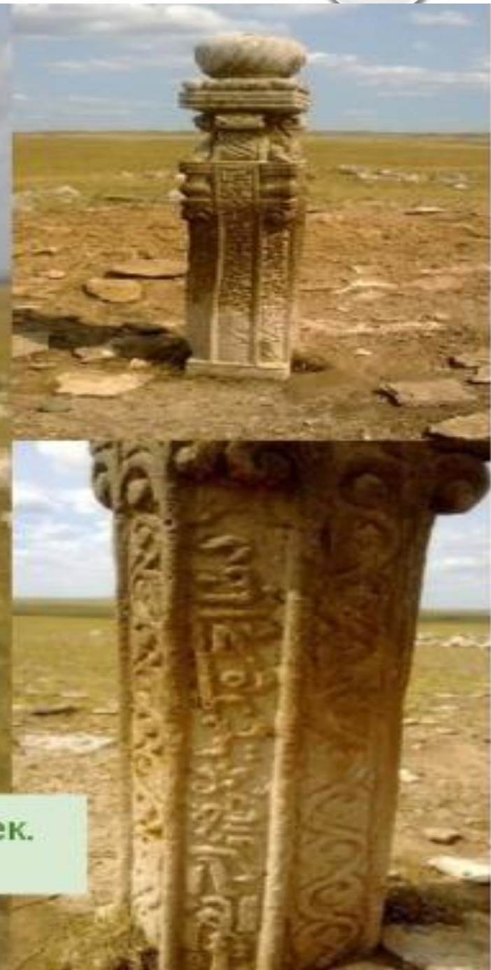
Култыпасы – захоронение киргиз-кайсаков, XVIII век. Оренбургская обл. Беляевский район.