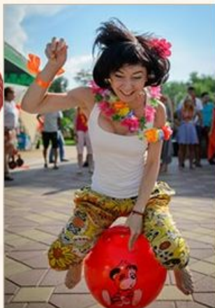
Корпоративные и частные праздники