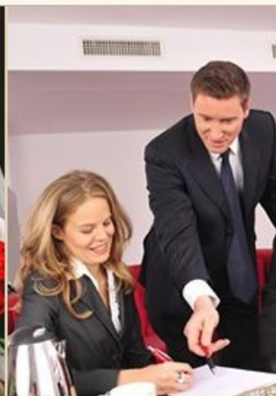
Деловые мероприятия и события