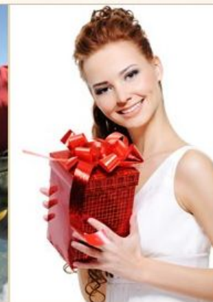
1 000 мелочей для вашего праздника