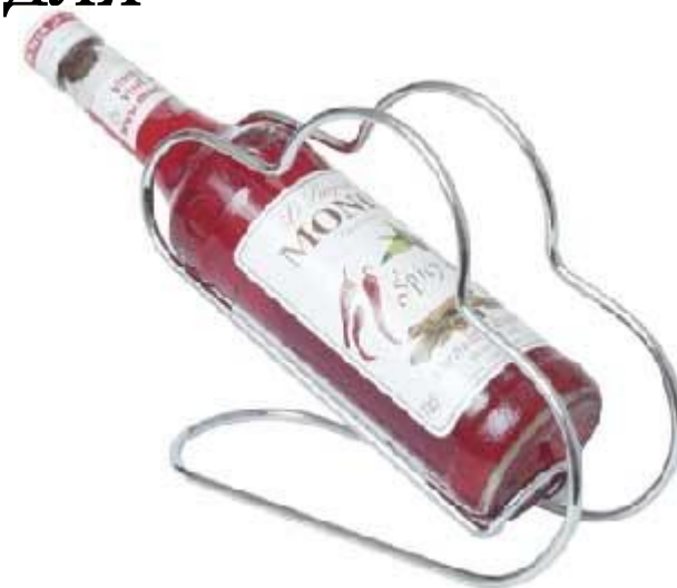
Подставка для красного вина