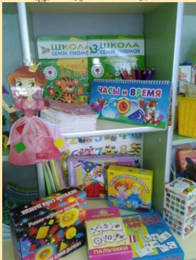
Центр «Веселый счет» средняя группа