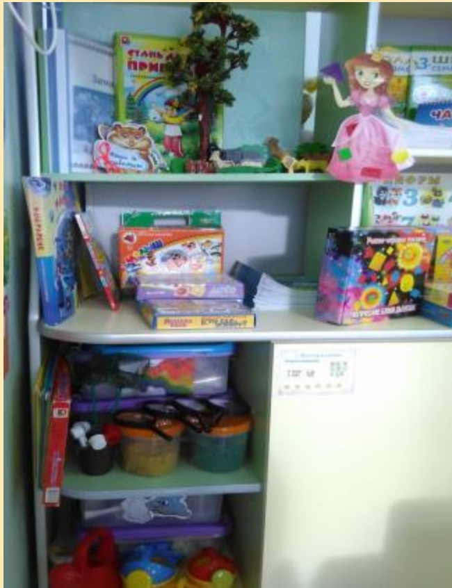
Центр «Любознательные детки» средняя группа