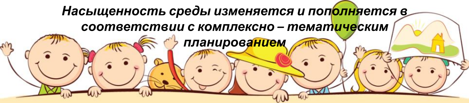
«Вот и стали мы на год взрослее»