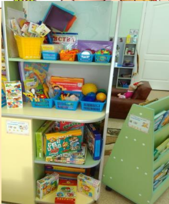
Центр «Говори правильно» средняя группа