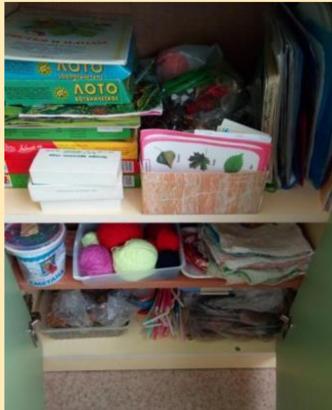
Лаборатория «Удивительные превращения» подготовительная к школе группа