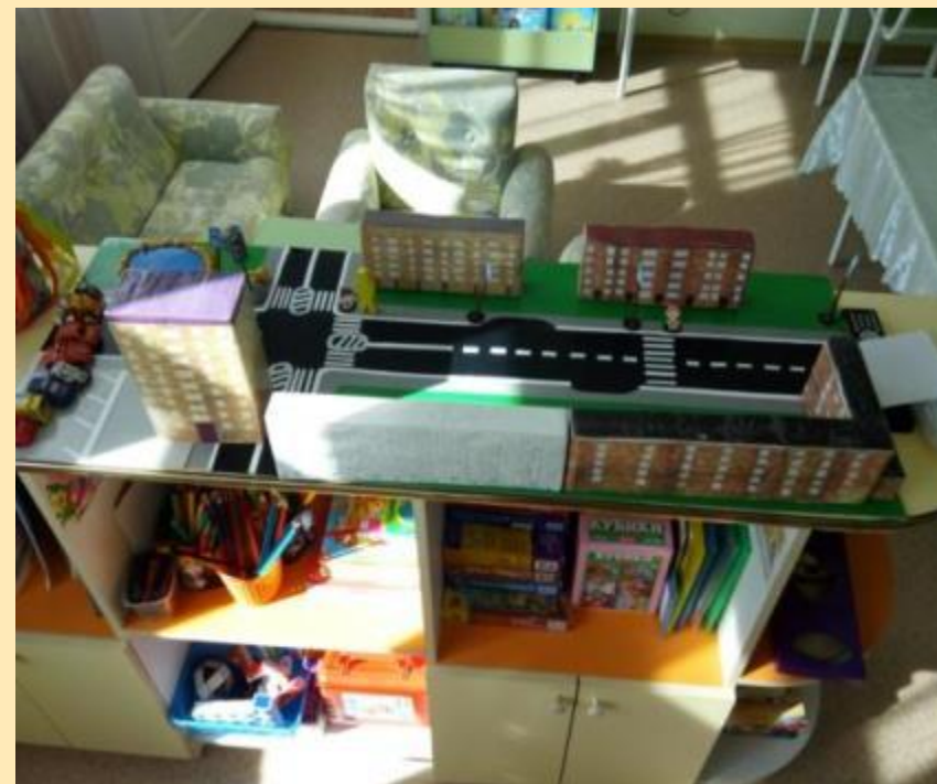
Подготовительная к школе группа