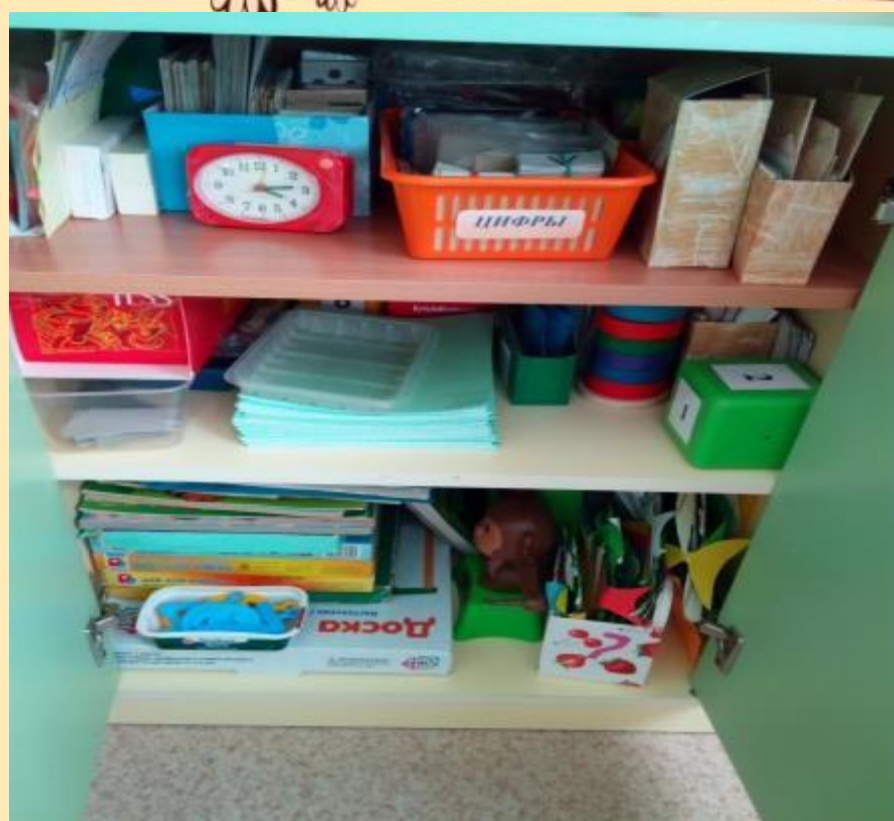
Центр математики «Веселый счет» подготовительная к школе