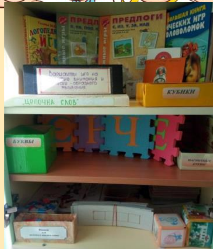
Центр «Говорунок» подготовительная к школе группа