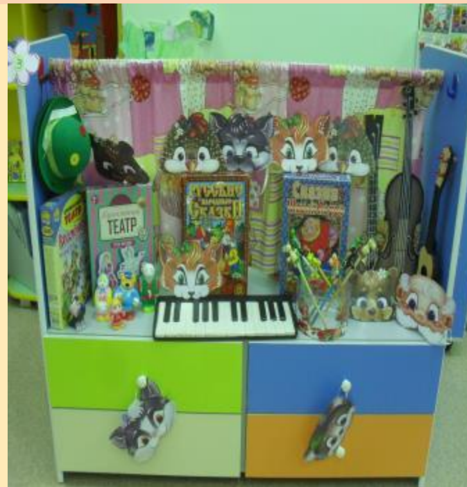
Подготовительная к школе группа