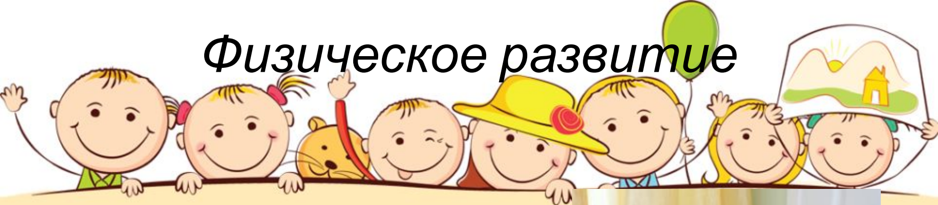
Центр «Малыши - крепыши» средняя группа