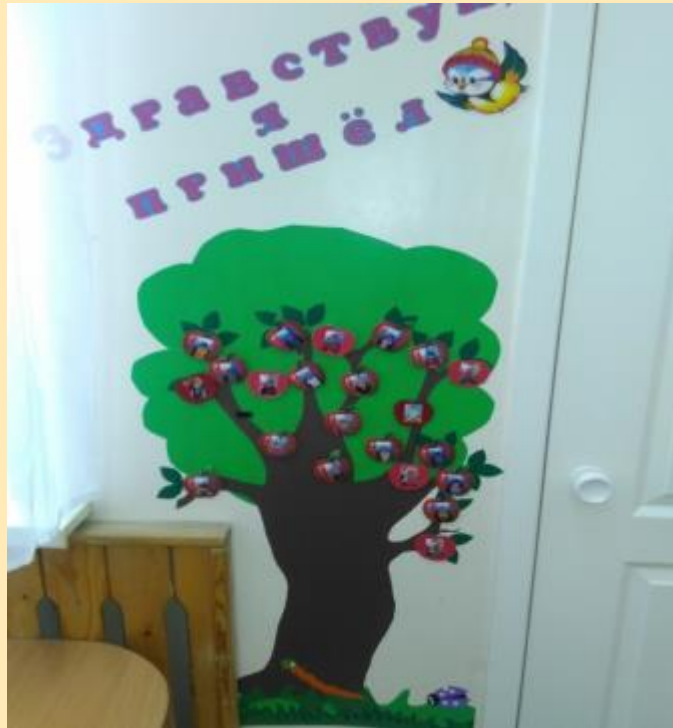
Центр «Шепталочки» подготовительная к школе