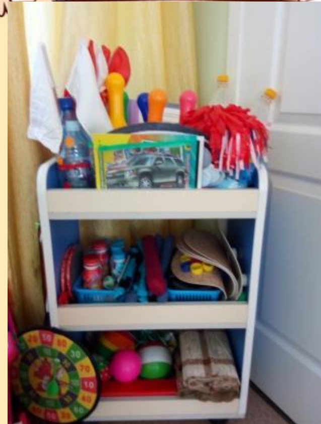
Центр «Олимпийцы» Подготовительная к школе группа