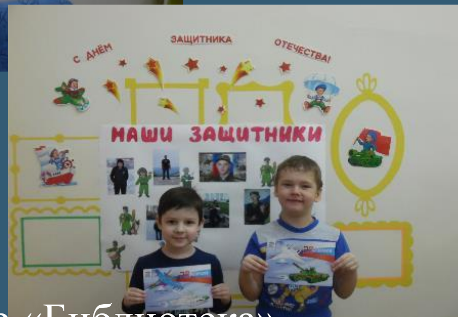
Экспозиция в центре «Библиотека»