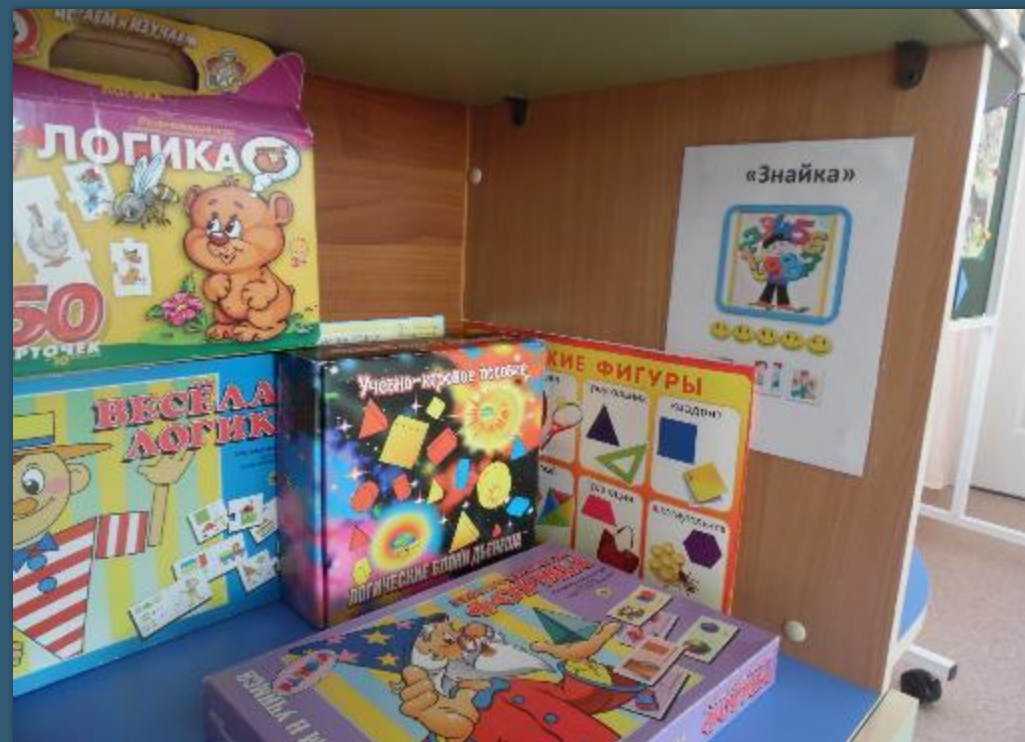
Логико-математический центр «Знайка»