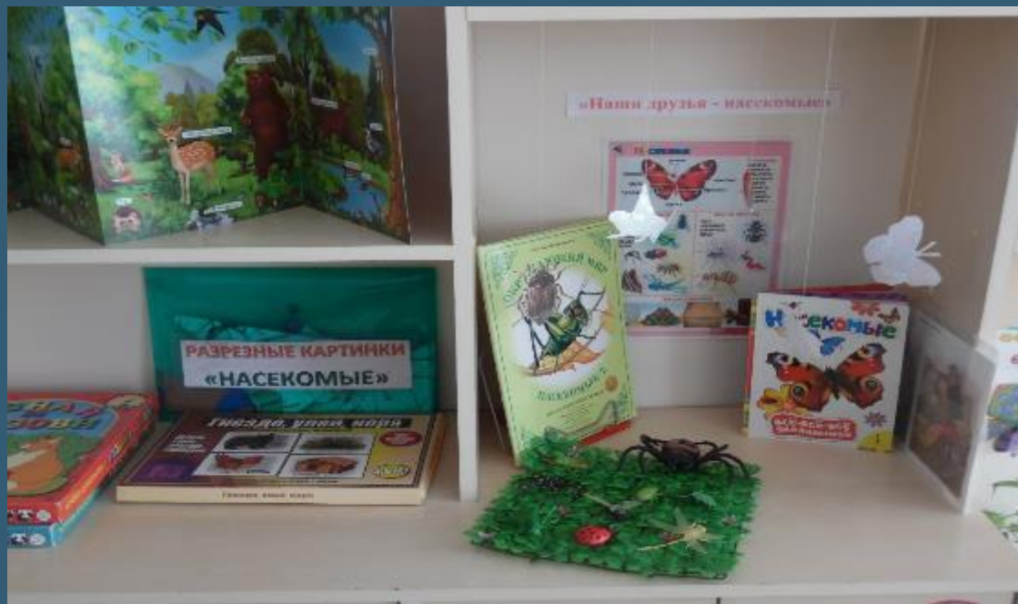
Центр знакомства с окружающим миром «Почемучки»