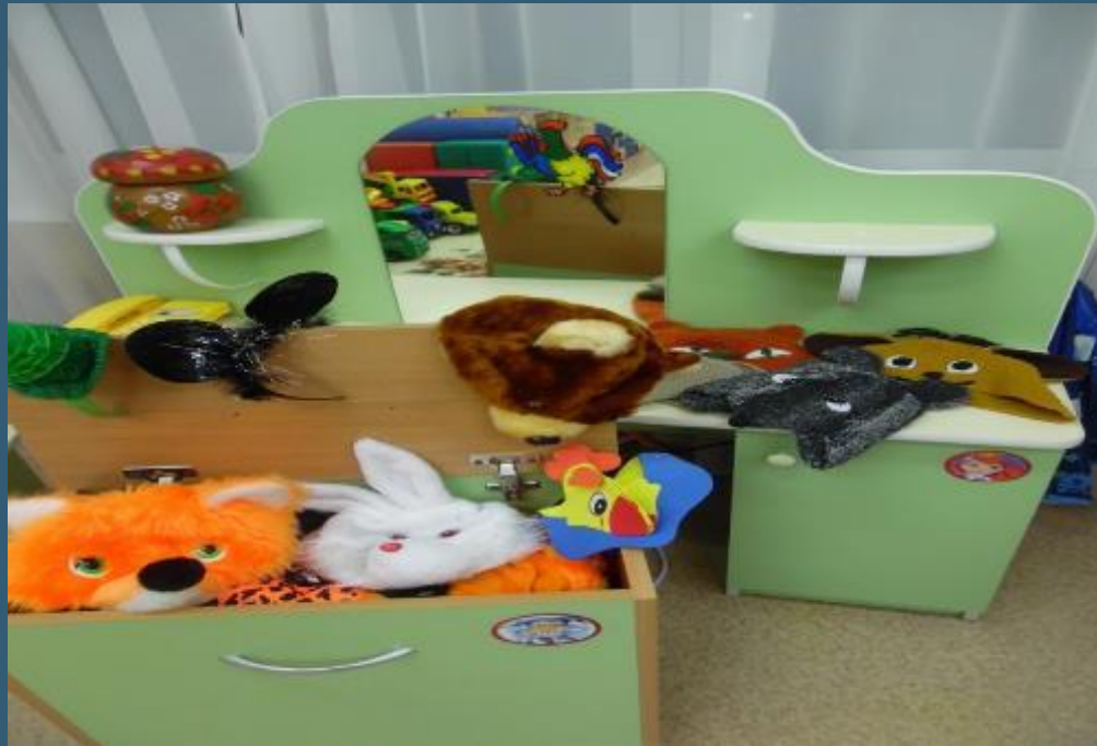
Центр «Юные артисты»