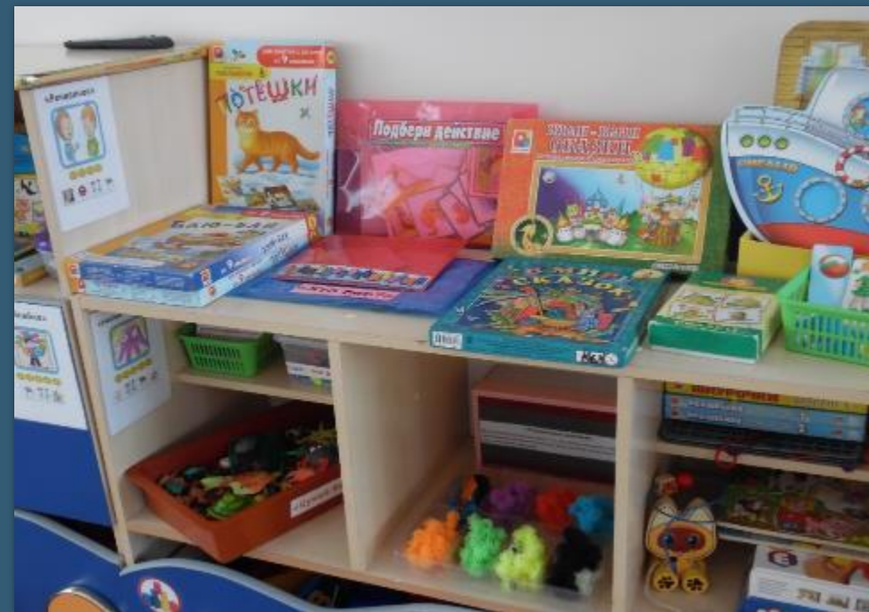
Подготовительная к школе группа