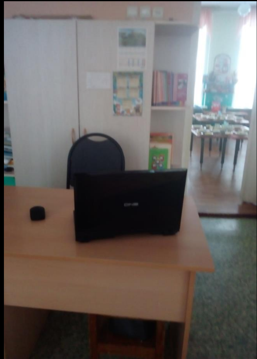
1.7. Рабочий сектор (ИКТ для педагога)