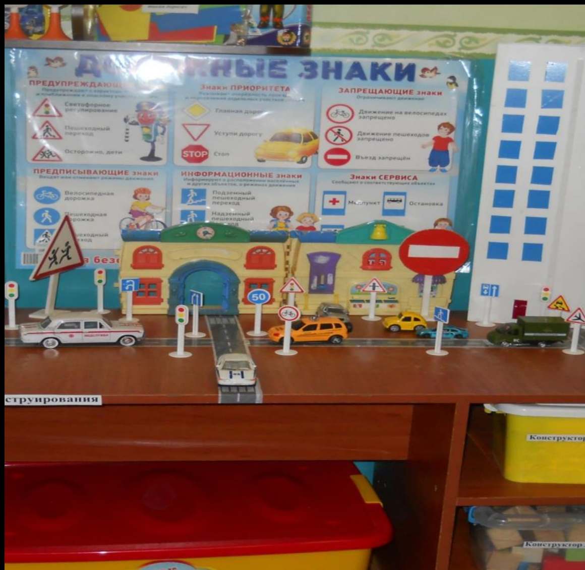
2.34 Активный сектор . «Дорожное движение»