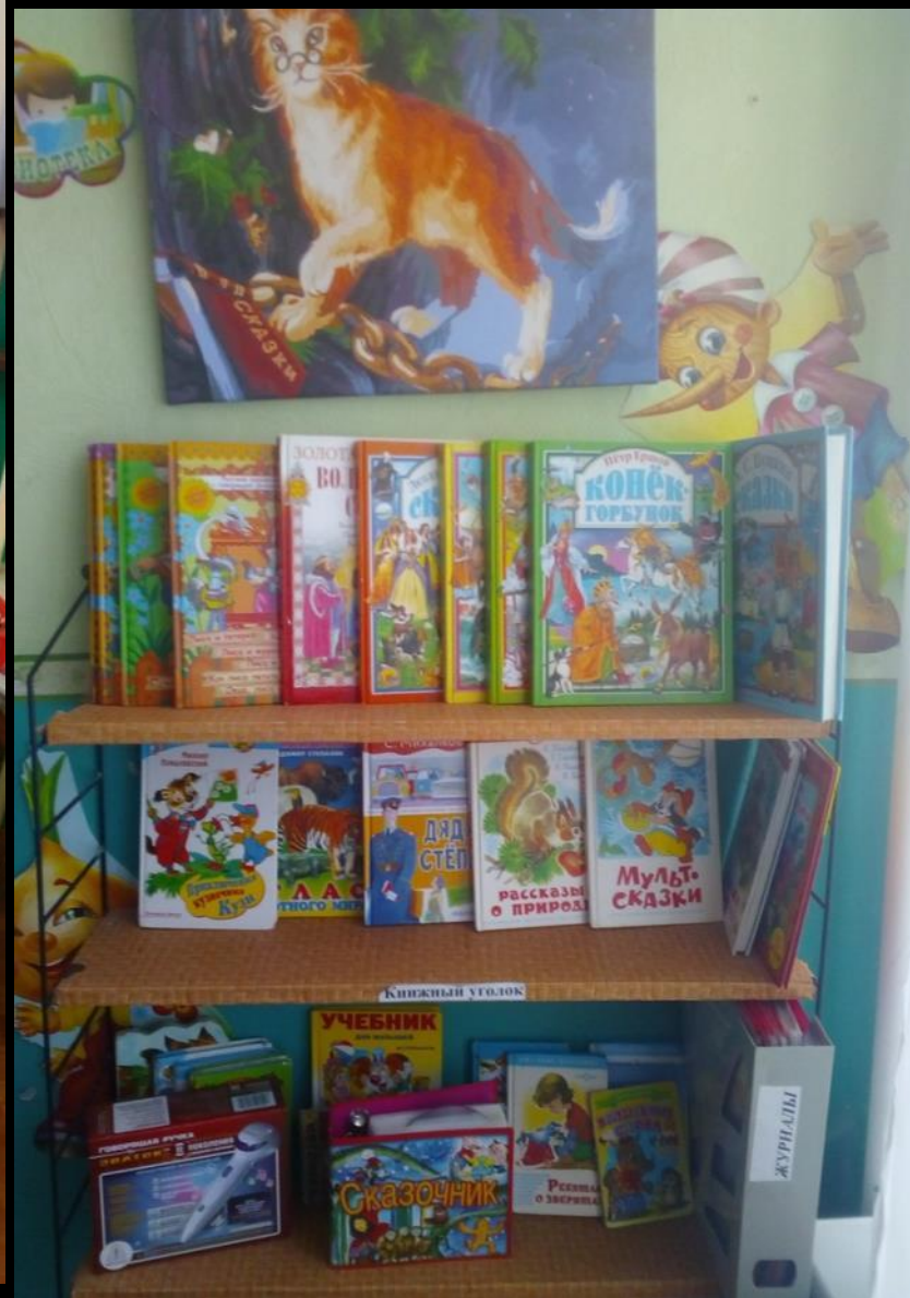
3.2 Спокойный сектор: «Центр литературы»