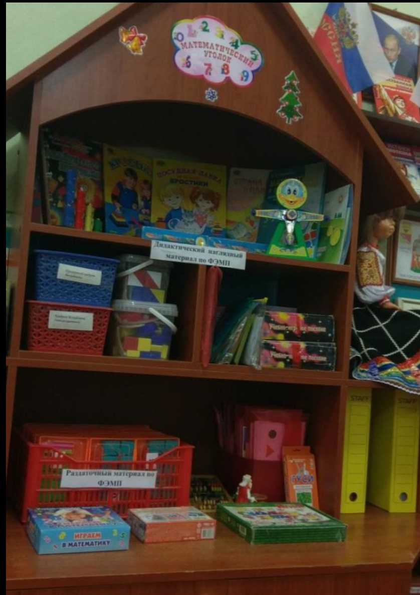
1.5 Рабочий сектор: «Математическое развитие»