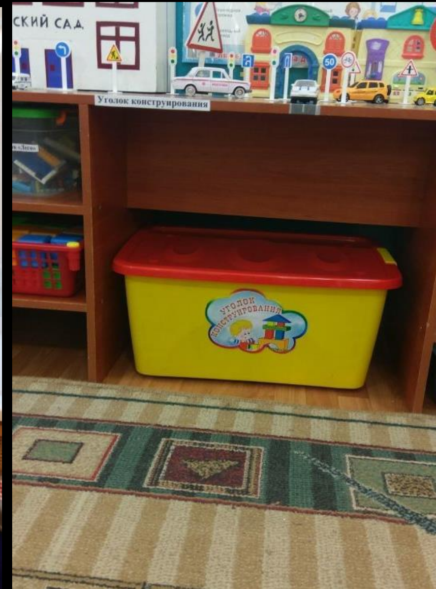
1.3 Рабочий сектор: «Конструирование»