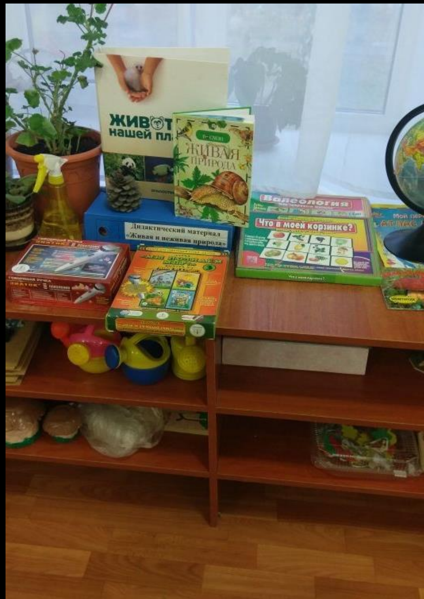
1.1 Рабочий сектор «Живая., неживая природа»