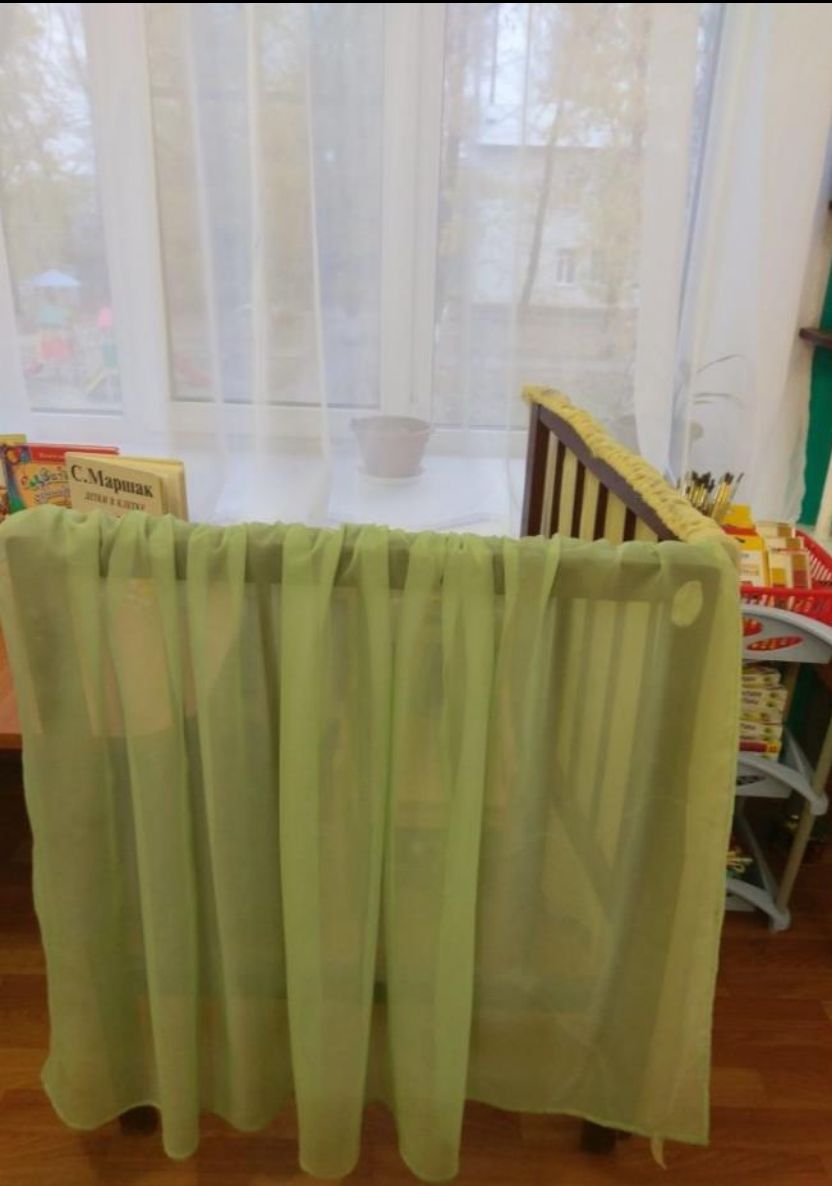
3.1 Спокойный сектор: «Место для отдыха и уединения»