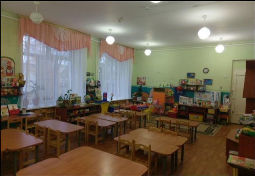
Верхняя левая точка