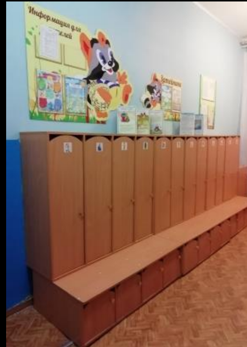
Среда для диалога с родителями