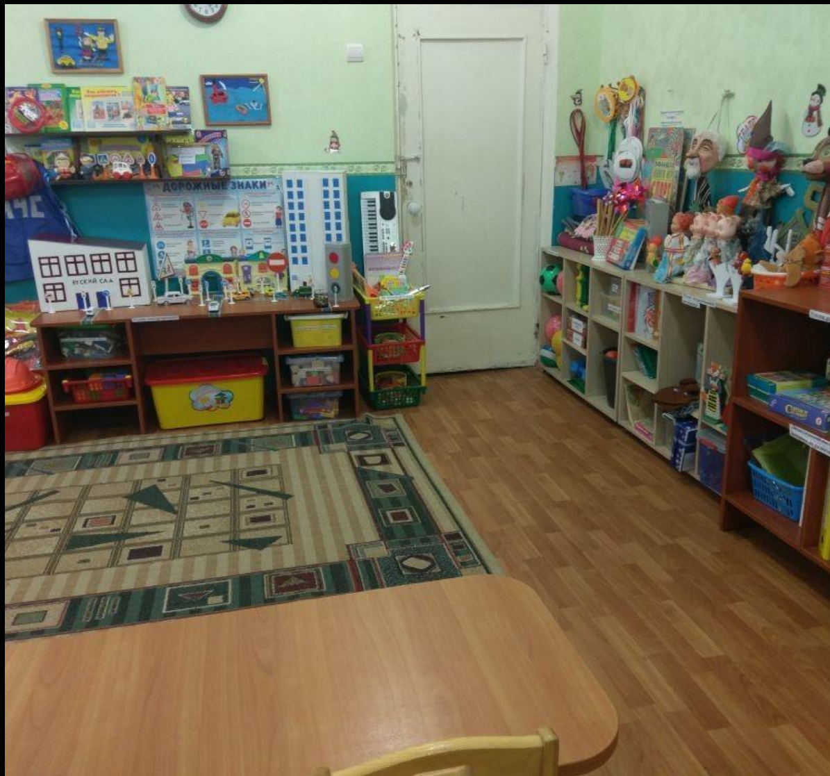
2.9 Активный сектор