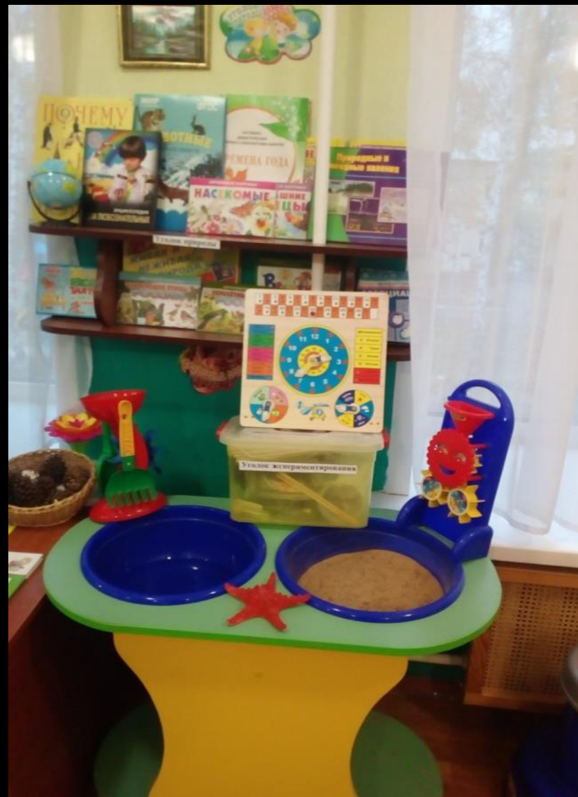
1.2 Рабочий сектор : «Экспериментирование – исследовательская деятельность»