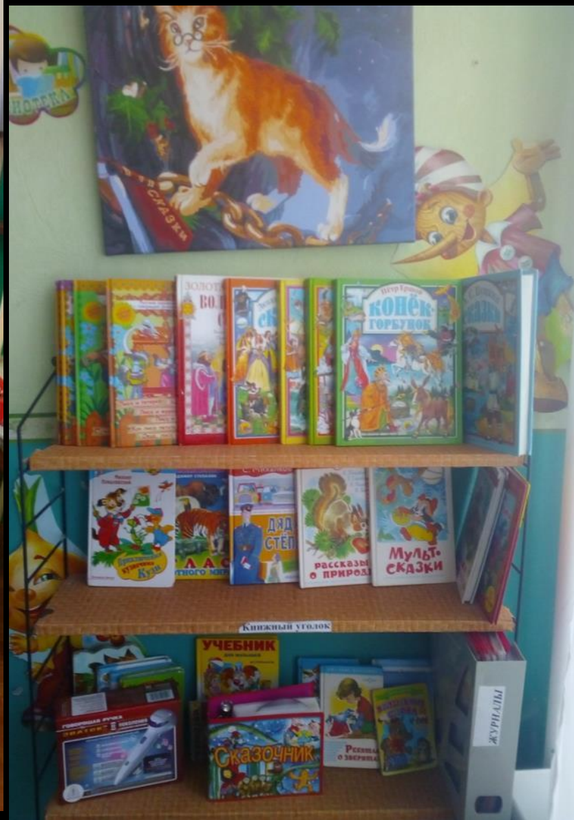
3.2 Спокойный сектор: «Центр литературы»