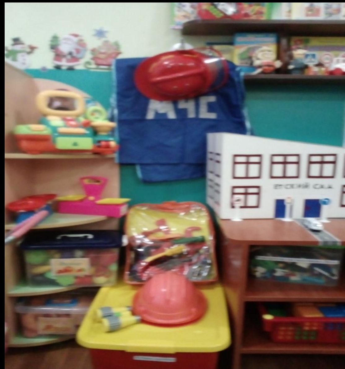
2.5 Активный сектор: Сюжетно-ролевые игры: «Автопарковка», «Строители»