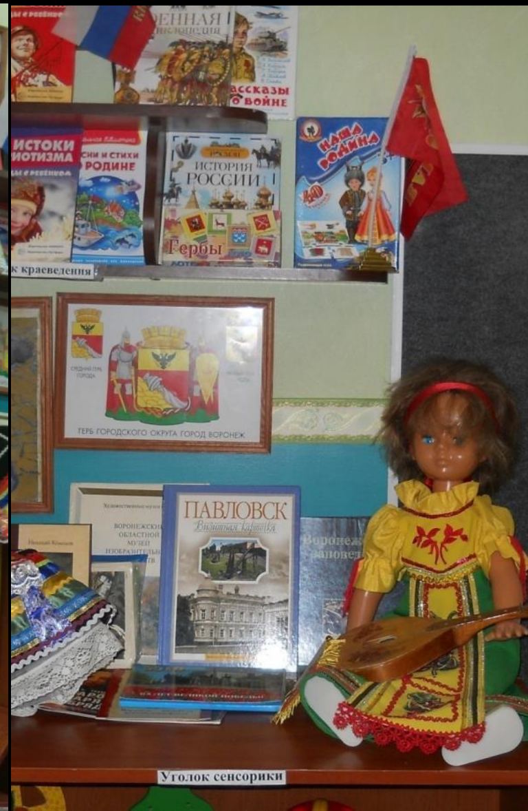
1.6 Рабочий сектор: «Наследие культуры и социокультурные ценности»