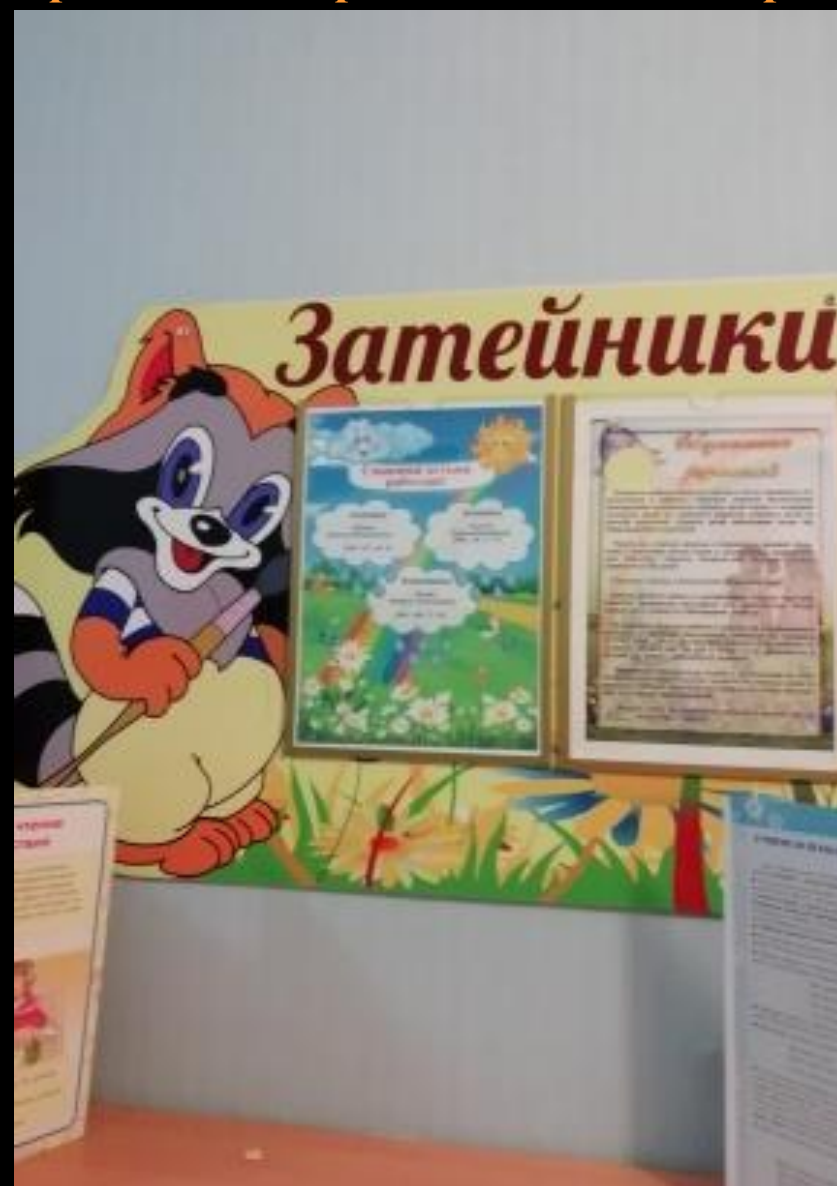
Среда для диалога с родителями