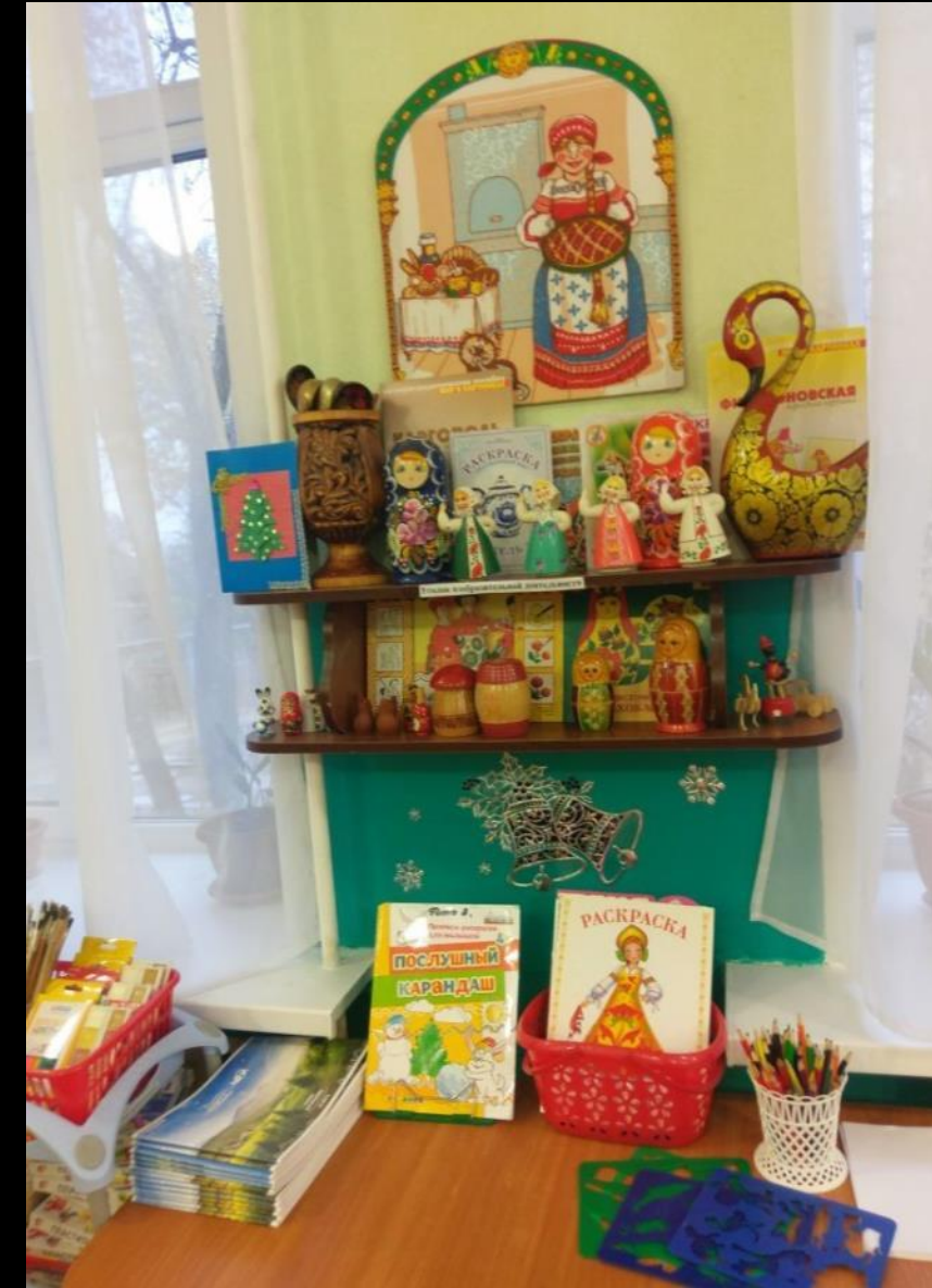
3.3 Спокойный сектор: «Центр творчества»