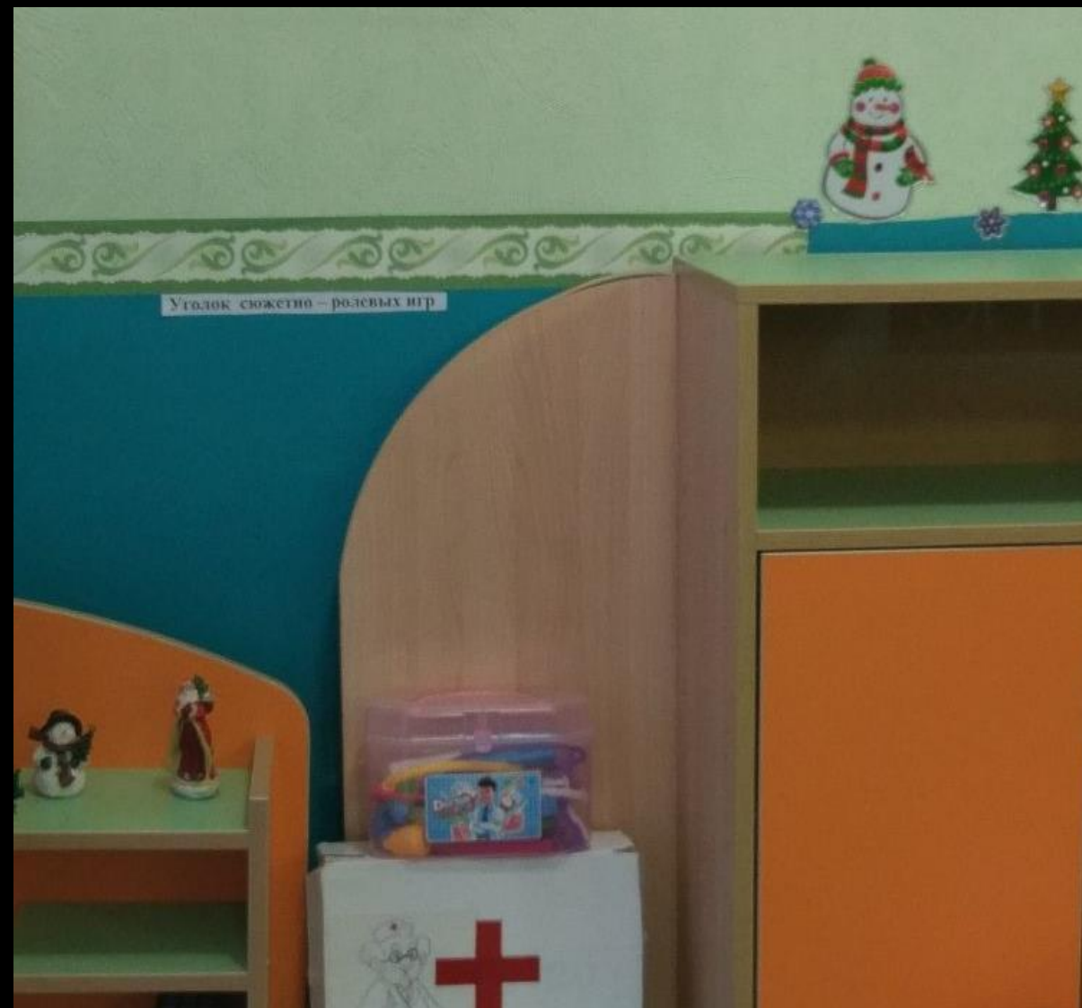
2.10 Активный сектор: Сюжетно ролевая игра: «Больница».