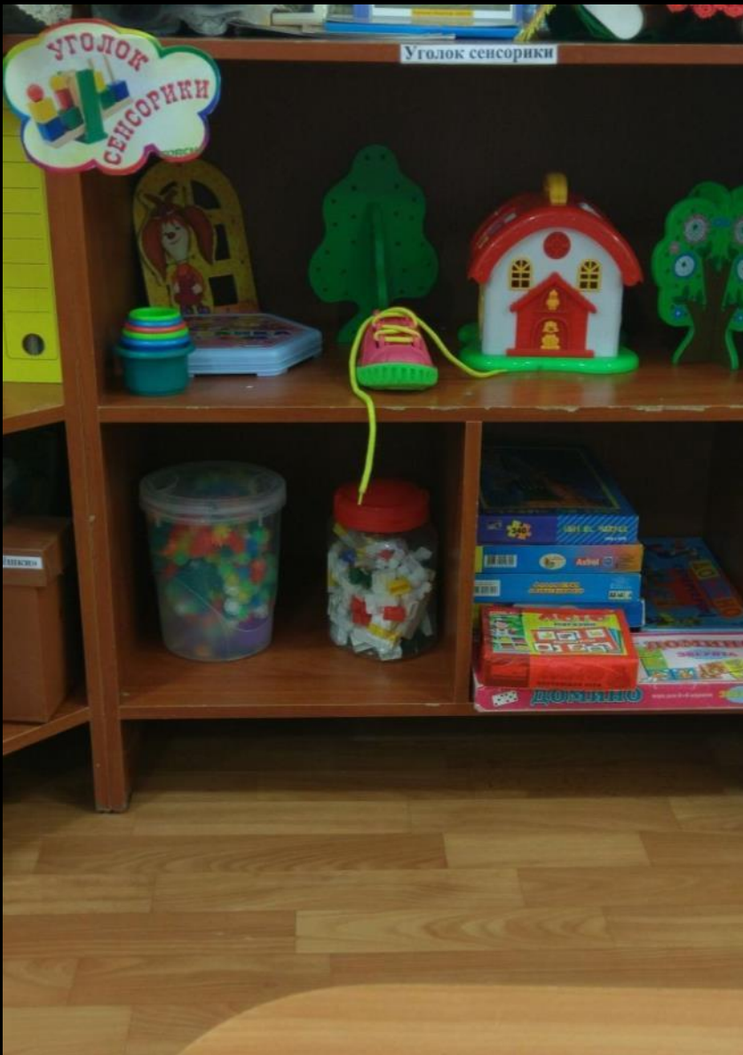
1.4 Рабочий сектор: «Сенсорика, конструирование»,