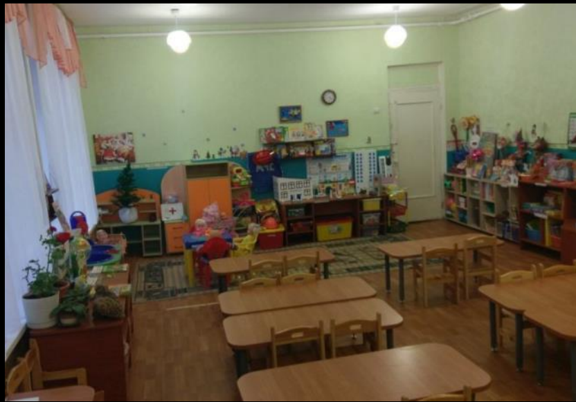
Верхняя правая точка