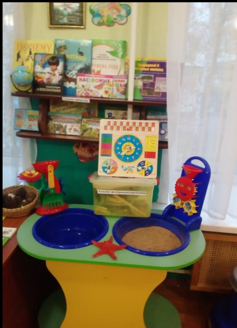
1.2 Рабочий сектор : «Экспериментирование – исследовательская деятельность»