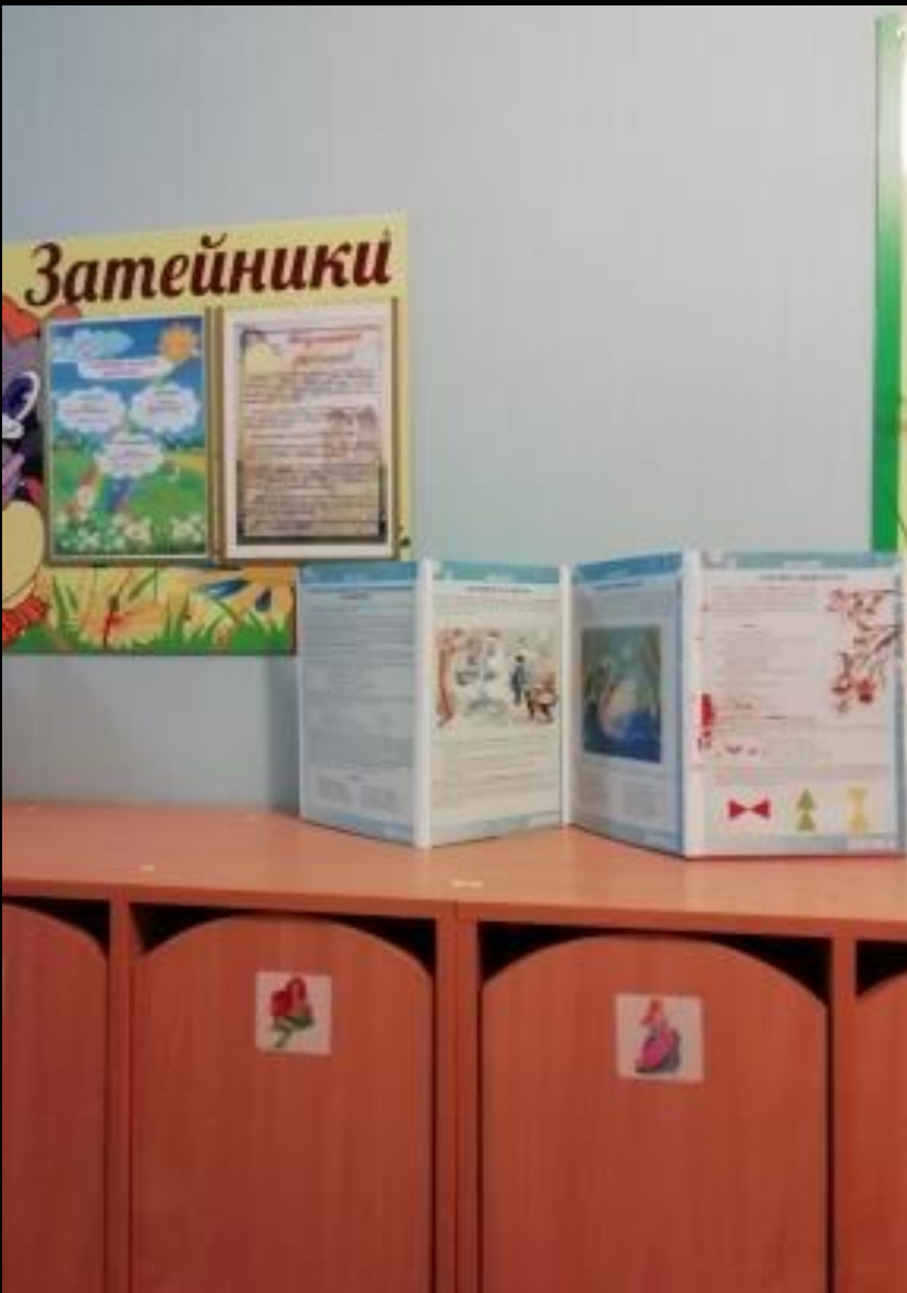
4.1 Среда для диалога с родителями «Информационно-консультативный блок»