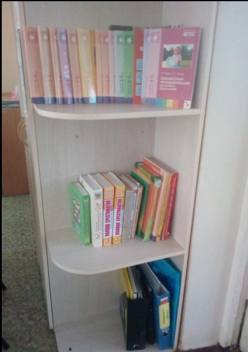
1.6. Рабочий сектор (методическая литература педагога)