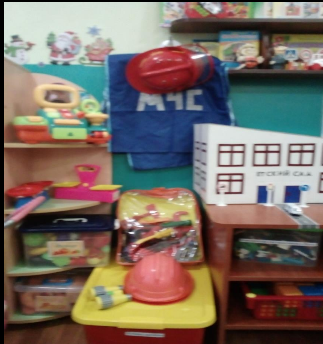
2.5 Активный сектор: Сюжетно-ролевые игры: «Автопарковка», «Строители»