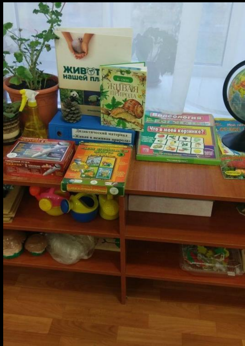
1.1 Рабочий сектор «Живая, неживая природа»