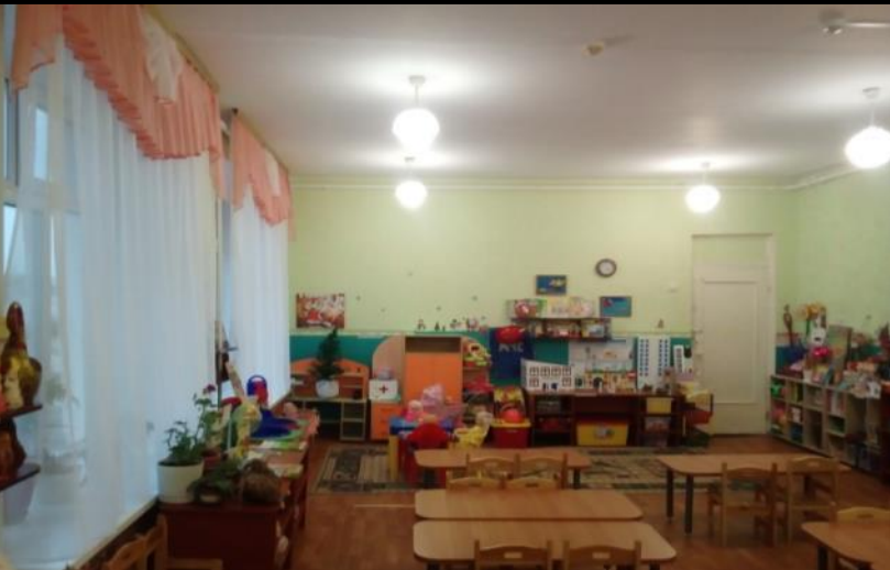
Вход в группу, нижняя левая точка