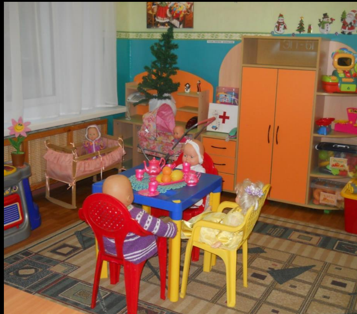
2.3 Активный сектор : «Семья»