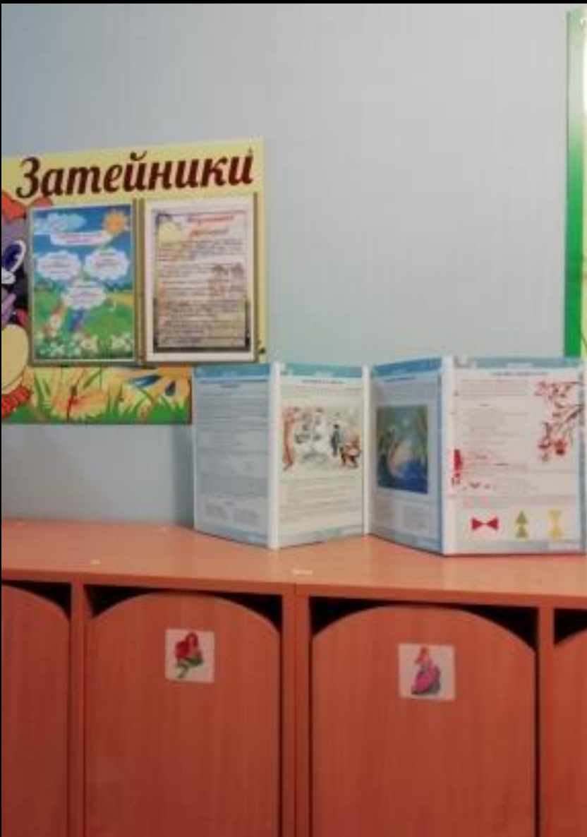
4.1 Среда для диалога с родителями «Информационно-консультативный блок»