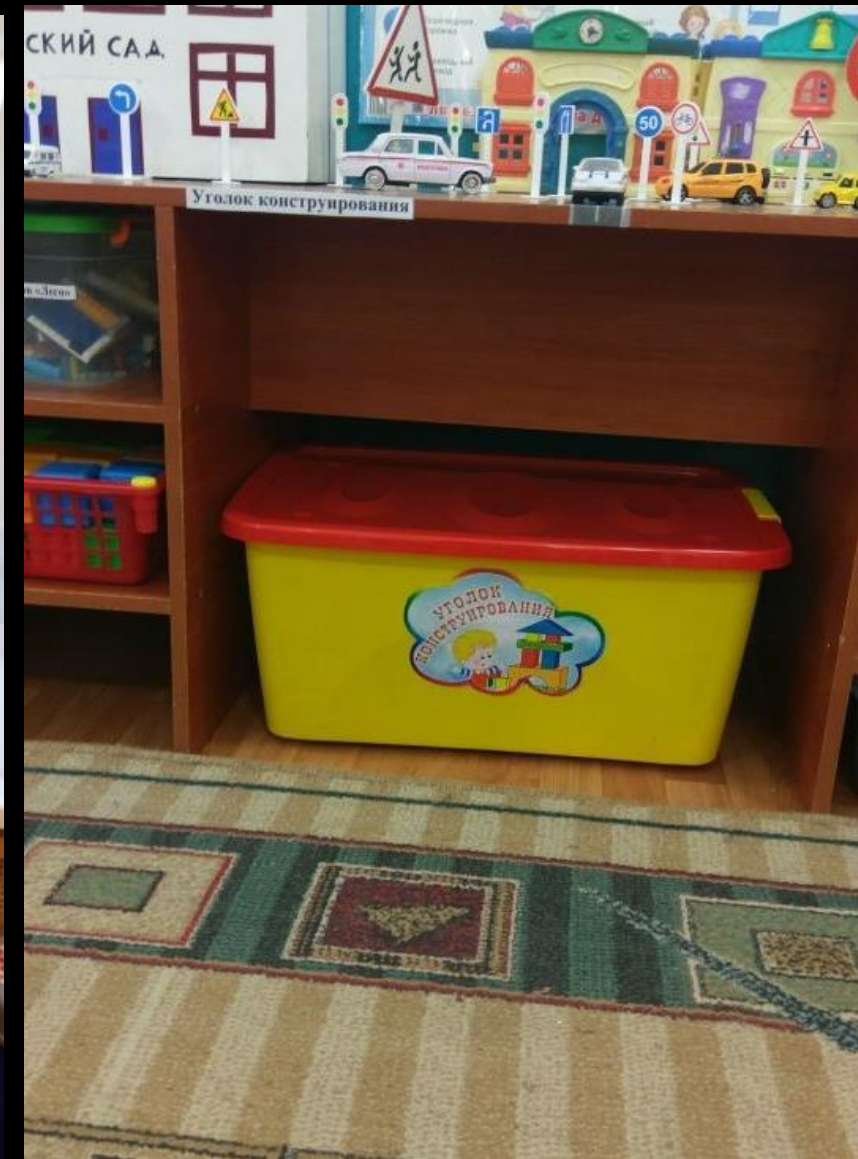
1.3 Рабочий сектор: «Конструирование»