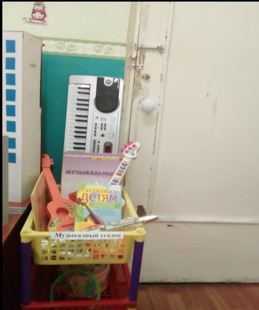
2.7 «Мир звуков и музыки»