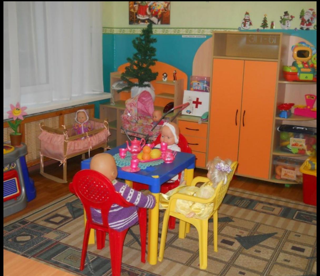
2.3 Активный сектор : «Семья»