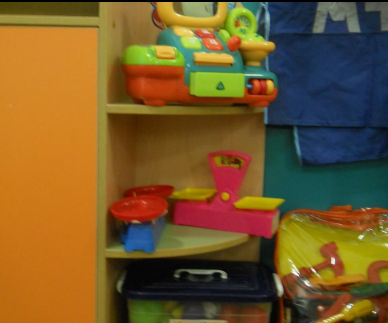
2.2 Активный сектор. Сюжетно-ролевые игры: «Магазин», «»