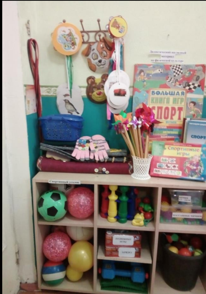
2. Активный сектор 2.1 «Физкультура и спорт»