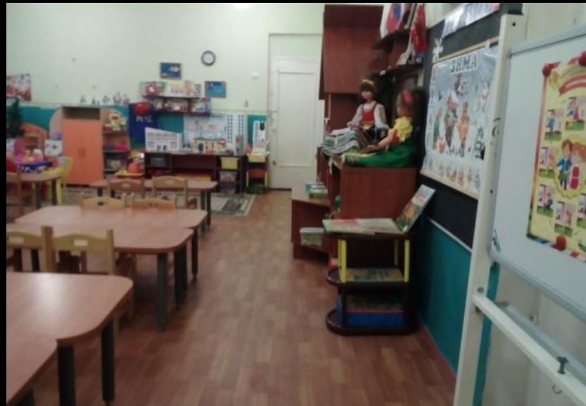
Нижняя правая точка