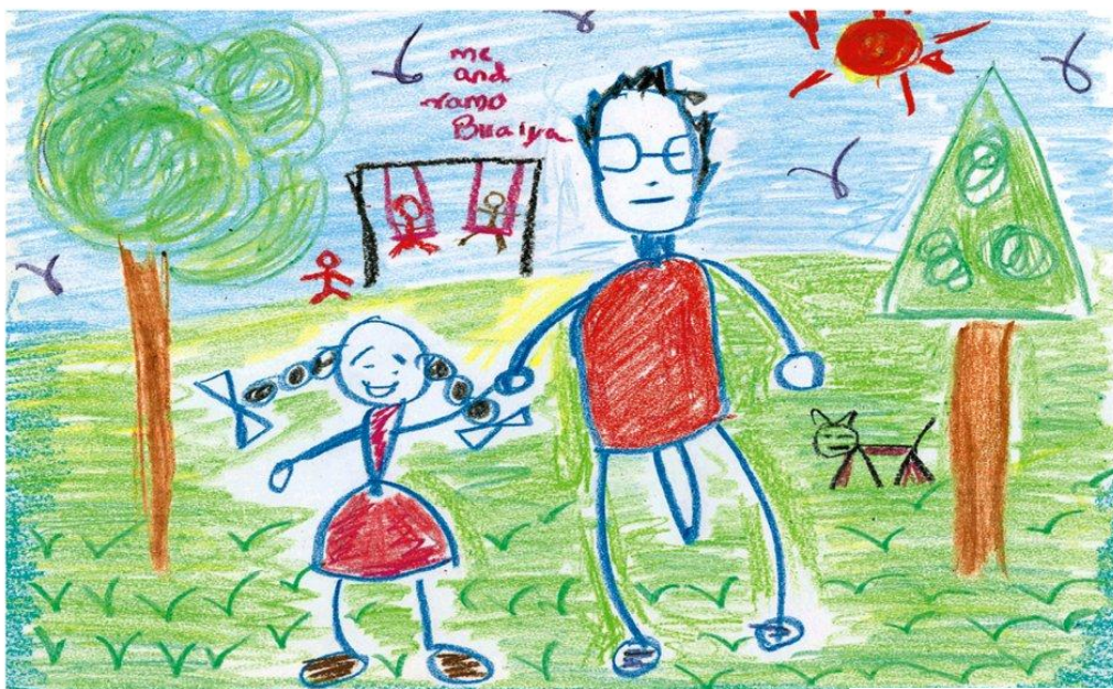
Рисунок ребенка, испытавшего сексуальное насилие в семье

Sexual abuse of children is usually by si