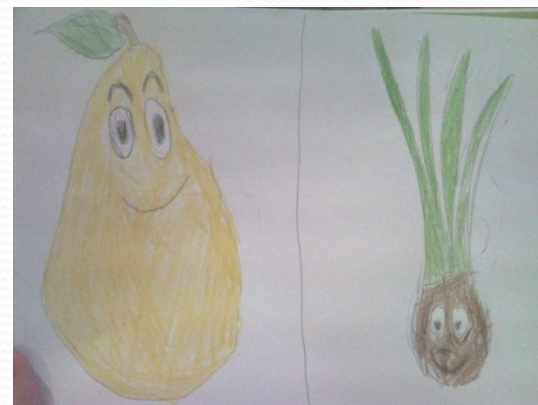
Работы учеников 1-го класса.