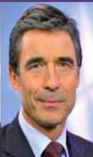
Manfred Wörner 1988-1994