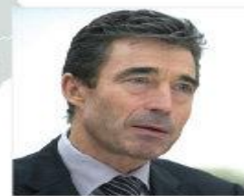
Генеральный секретарь НАТО Андерс Фог Расмуссен