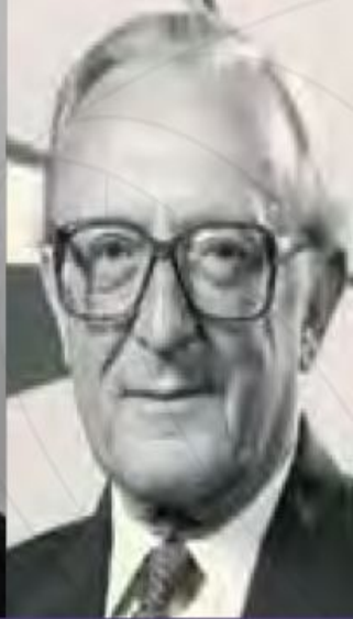
Lord Ismay 1952-1957