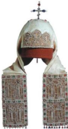
Белый кlobук патриарха Никона