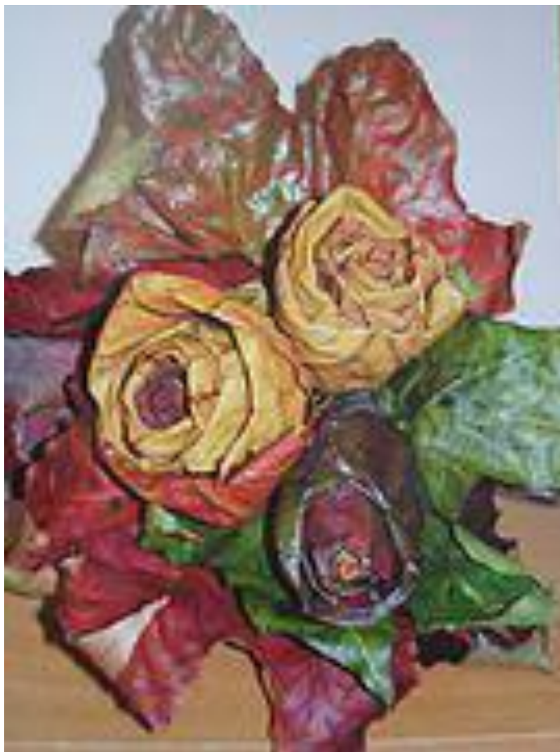
«букет из роз»