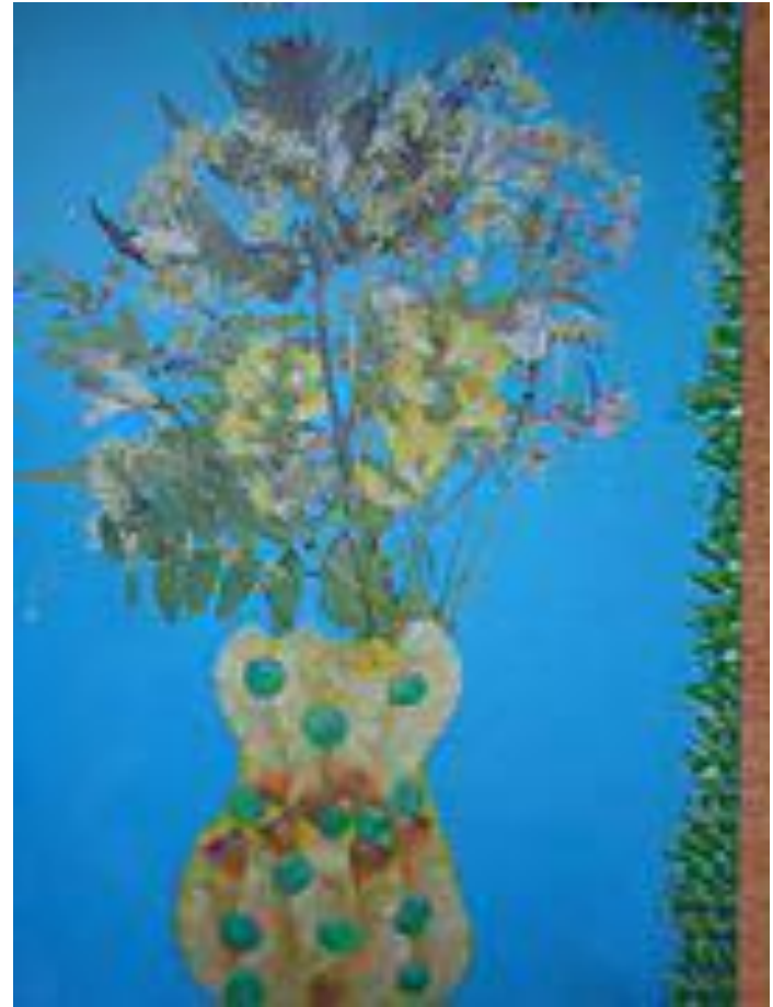
«Ваза с цветами»