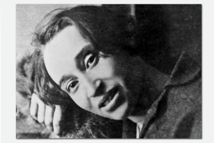
Надежда Яковлевна Мандельштам (Хазина)