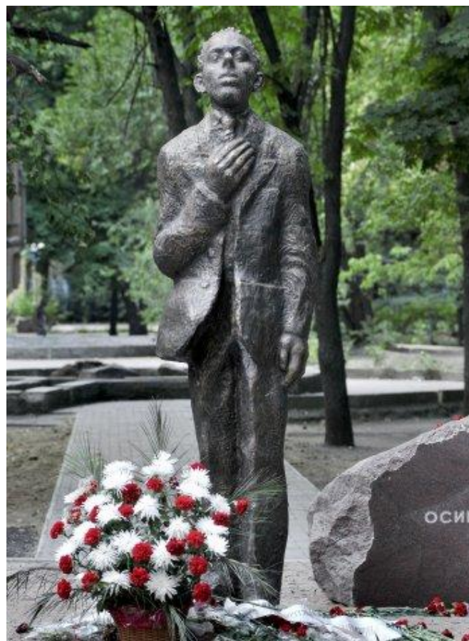
Памятник Мандельштаму в Воронеже

27 декабря Осип Мандельштам умер в лагере на Второй речке. Он скончался от тифа и вместе с другими несчастными похоронен в братской могиле. Место захоронения Мандельштама неизвестно.