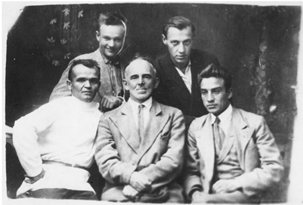
В Воронеже, декабрь 1935

Надежда Мандельштам ищет способы спасти мужа и пишет во все инстанции, друзьям и знакомым. Им позволяют переехать в Воронеж. Там в полной нищете они живут до 1937 года.