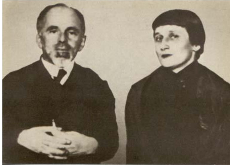
О. Мандельштам и А. Ахматова 1934

Он часто бывает в доме Гумилева, знакомится с Ахматовой. Впоследствии дружбу с ними он считает одной из самых больших удач в жизни.