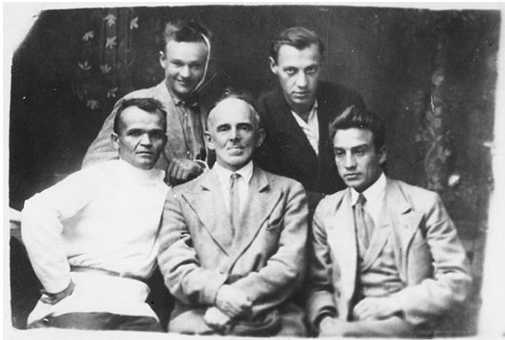
В Воронеже, декабрь 1935

Надежда Мандельштам ищет способы спасти мужа и пишет во все инстанции, друзьям и знакомым. Им позволяют переехать в Воронеж. Там в полной нищете они живут до 1937 года.