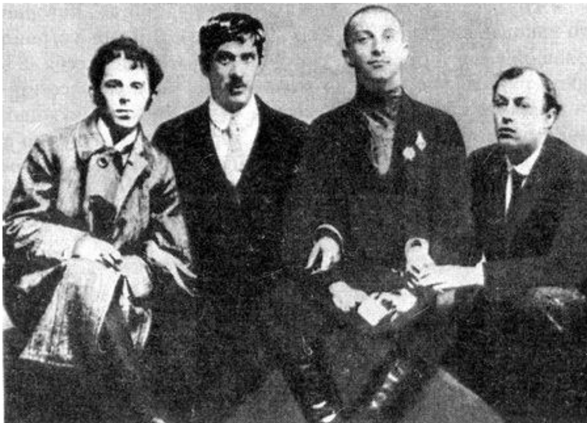
Осип Мандельштам, Корней Чуковский, Бенедикт Лившиц, Юрий Анненков. Петербург. 1914 г