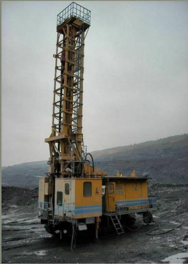
Станок буровой шарошечный СБШ-250-32 Дорус.ру