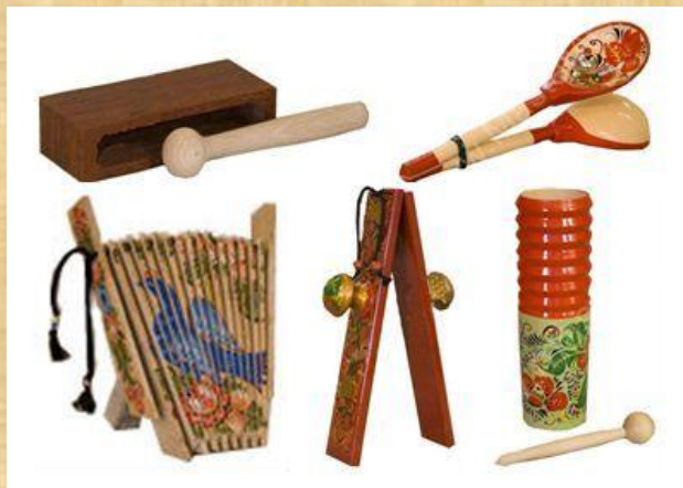
Народные музыкальные игрушки