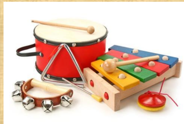
Детские музыкальные инструменты