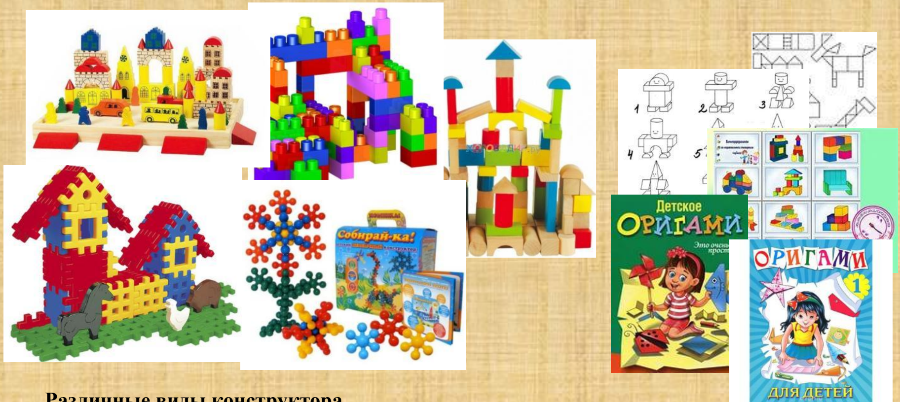
Различные виды конструктора