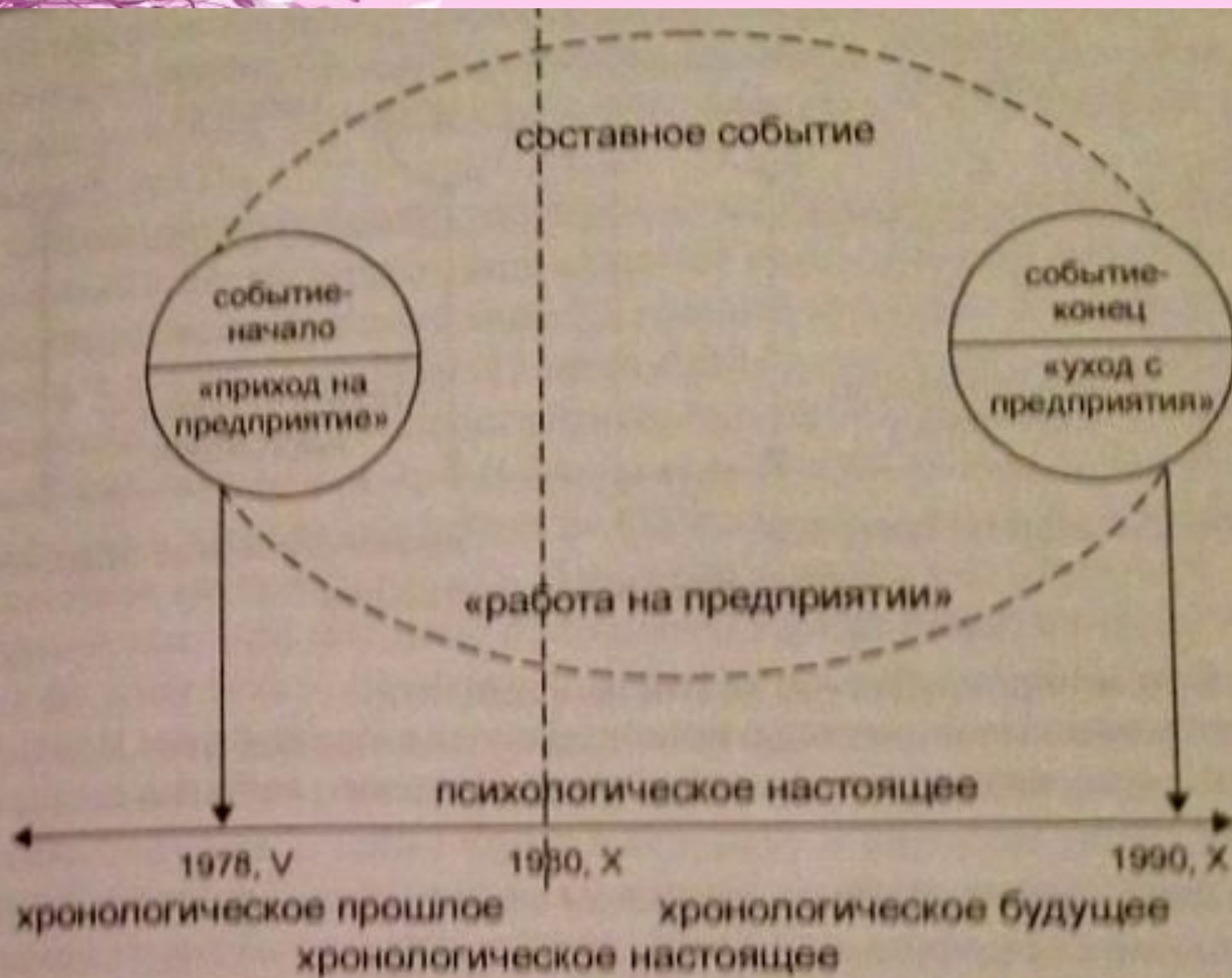
Рис. 1. Временная структура составного события