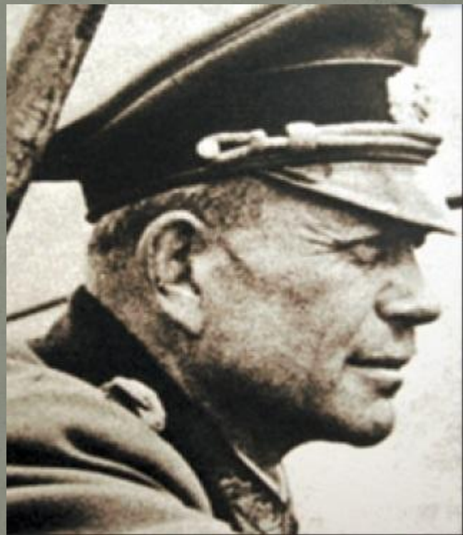
Гейнц Вильгельм Гудериан (1888-1954)

Фюрер Адольф Гитлер приказал Гудериану держаться до последнего, но генерал не послушал вождя и увел остатки армии из-под Тулы. Впоследствии за самовольство Гитлер отстранил Гудериана от командования танковой армией.