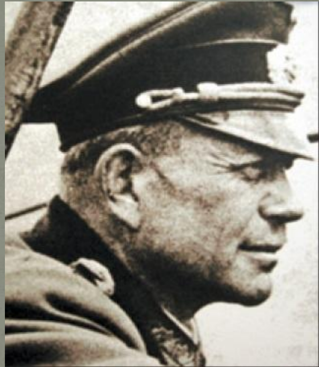
Гейнц Вильгельм Гудериан (1888-1954)

Фюрер Адольф Гитлер приказал Гудериану держаться до последнего, но генерал не послушал вождя и увел остатки армии из-под Тулы. Впоследствии за самовольство Гитлер отстранил Гудериана от командования танковой армией.