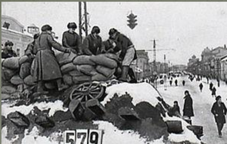
На рубежах обороны, 1941 год.

Защитники города готовы к бою. Тула, перекресток улиц Советской и Коммунаров (ныне проспект Ленина).