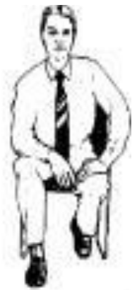
Рис. 97. Горняк и деловитость.